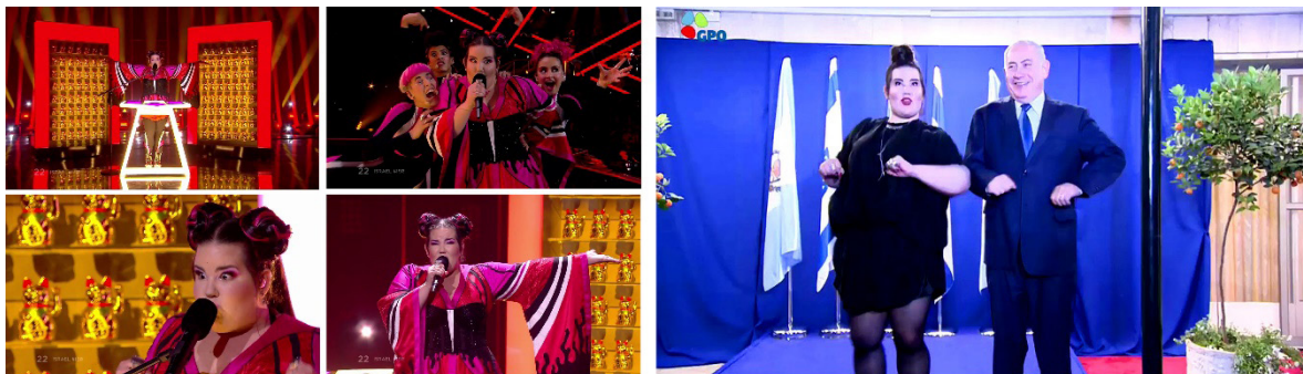
Cuadro 10: Netta, ganadora de Eurovisión 2018

Fuentes: Elaboración propia a partir de < https://www.youtube.com/watch?v=84LBJXaeKk4 > y < https://www.instagram.com/p/Bi2To7CBWnG/?taken-by=b.netanyahu > (derecha).