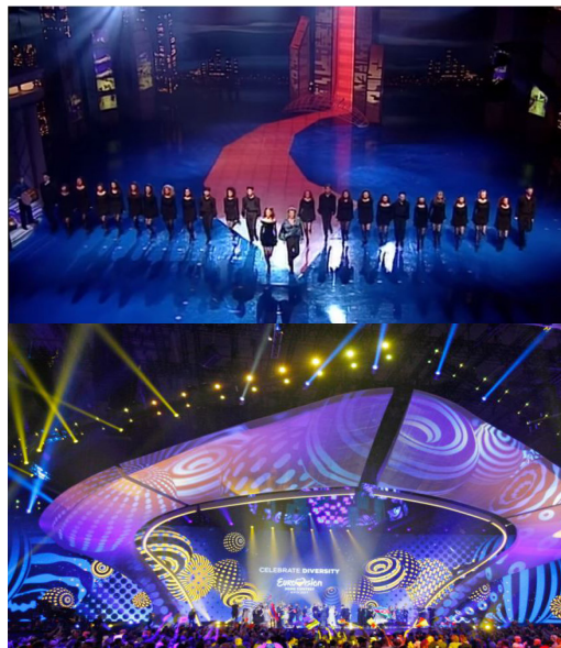
Cuadro 2: La sede de Dublín 1994 (izquierda) inspirada en los edificios de la noche dublinesa y Kiev 2017 (derecha), simulando las orillas del río Dniéper.