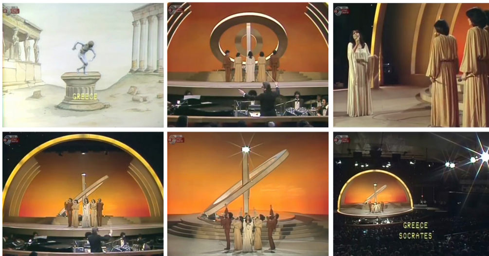
Cuadro 5: La actuación griega en el escenario de Jerusalén 1979.