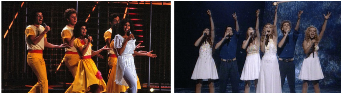
Cuadro 6: Ofra Haza en Múnich 1983 (izquierda) y Liora en Dublín 1995 (derecha).