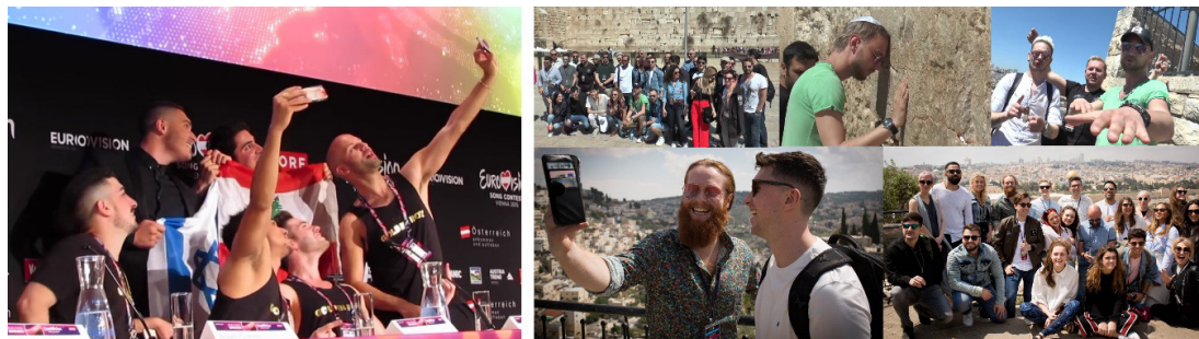
Cuadro 8: Rueda de prensa de Viena 2015 y visita de los concursantes de 2017 a Jerusalén.