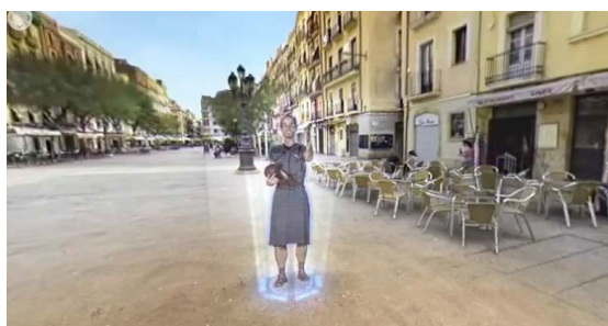
Cuadro 3: Fotograma de Circo en el que se ve al narrador indicar un lugar con la mano

Por medio de estos recursos se simula que el usuario es percibido por los sujetos del escenario narrativo con el fin de hacerle sentir que él también está presente allí.