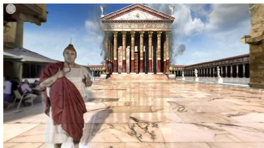
Cuadro 5: Fotograma de Anfiteatro en el que parte del escenario ha recuperado su apariencia romana

Las cuatro escenas presentan al principio un escenario en imagen real de distintas localizaciones monumentales de Tarragona. No obstante, a medida que el narrador describe lo que antaño había sido el lugar, el escenario se va transformando hasta mostrar los recintos o edificios que existían en Tarraco durante la época de la colonia romana. De este modo, las piezas presentan recreaciones generadas de manera sintética por ordenador con RV de espacios existentes en el pasado.