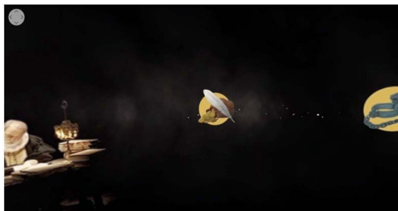
Cuadro 2: Fotograma de Cervantes VR en el que se observa el menú de escenas

Cervantes VR permite también una navegación interactiva. Tras la introducción, el usuario se encuentra con un menú de seis capítulos -siete una vez haya visto los otros- representados por iconos ilustrativos. Con los movimientos de su cabeza podrá seleccionar las diferentes opciones como si se tratase de un ratón. La inclusión de esta función no solo genera interactividad, sino también una cierta capacidad de participación narrativa.