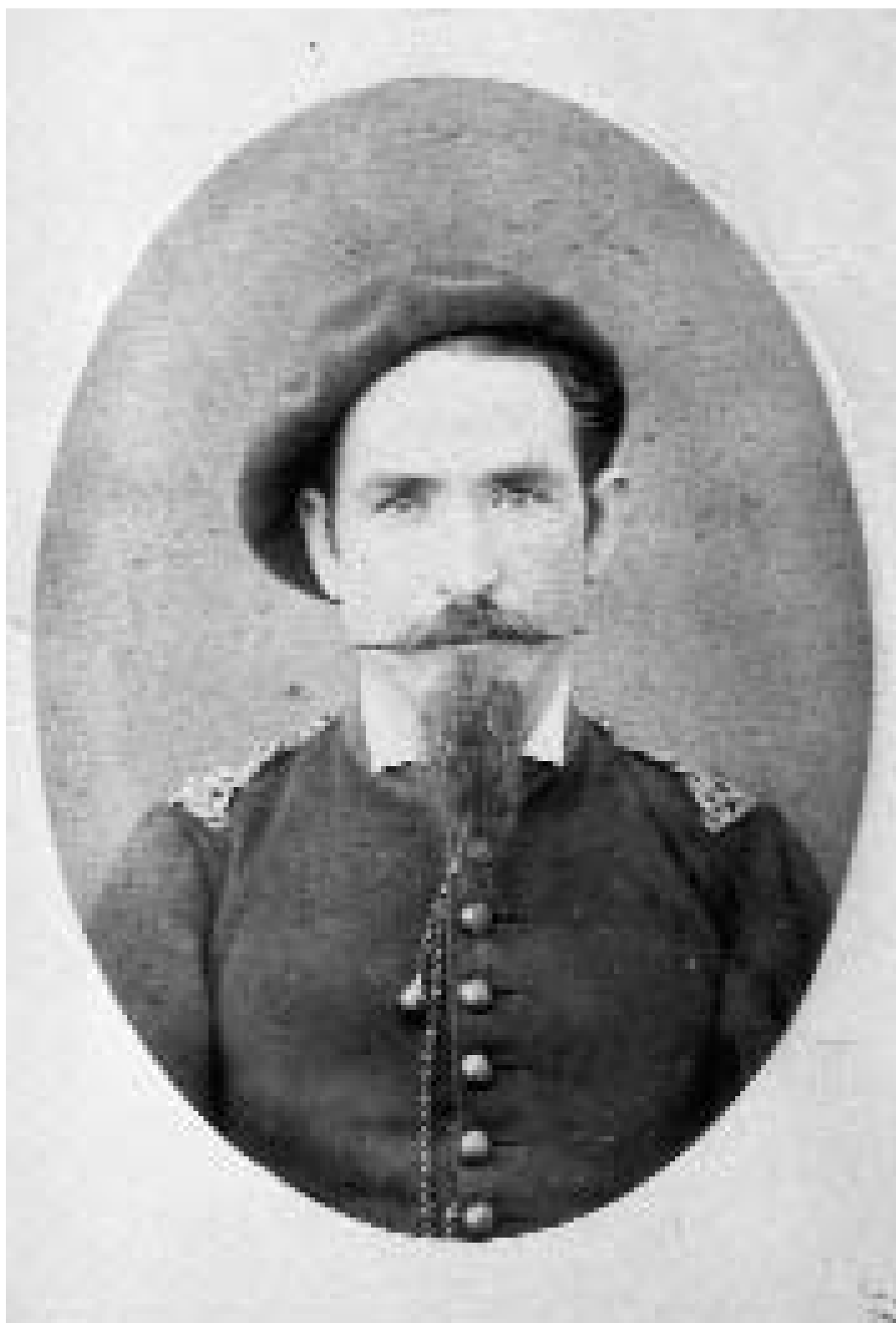
Foto 4: Comandante Pedro Calvo y Fuertes. Natural de Báguena, fue Ayudante de Marco de Bello durante gran parte de su carrera militar y hombre de su entera confianza; aparece ampliamente citado en su correspondencia.