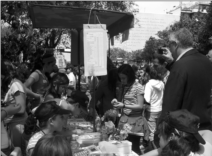
Visita al Mercado de Emprendedores Escolares en Oviedo.