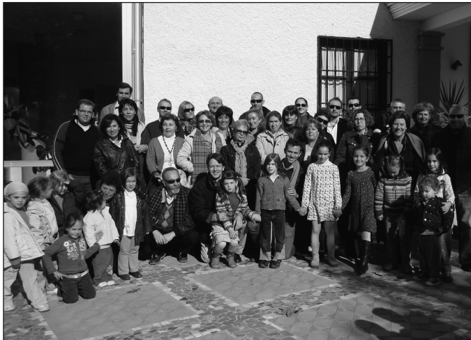
Participantes en la reunión de planificación del proyecto EME celebrada en Granada