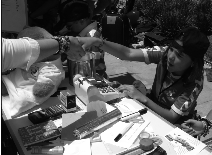
Transacción comercial en el mercado celebrado en Málaga