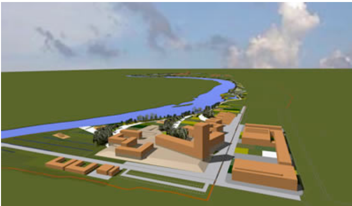
Ilustración 9. Perspectiva desde el Sur - Nuevo Campus de Villamayor de la Universidad de Salamanca, España