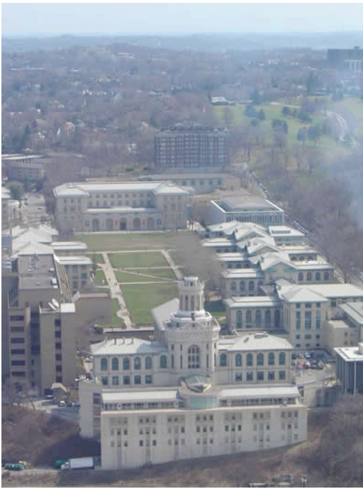
Ilustración 8. Campus Pittsburgh de la Universidad Carnegie Mellon, EEUU

“La Universidad norteamericana es un mundo en sí, paraíso temporal, etapa grata de la vida”. (Le Corbusier, 1979)