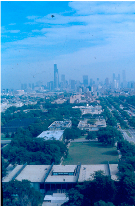
Ilustración 11. Campus del Illinois Institute of Technology, Chicago, EEUU