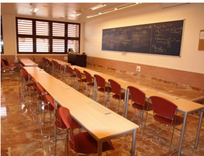
Ilustración 25. Aulas adaptadas a Bolonia, Campus de Leganés de la Universidad Carlos III de Madrid, España

La planificación de las acciones de adaptación al EEES debiera estructurarse mediante sucesivos Planes Directores, realizados a las escalas que cada Universidad recomiende (relación urbana, Campus o edificio). El nivel más detallado de dichos planes se remitirá al aula, como célula-tipo y unidad básica de docencia. Sería aconsejable que, como labor previa (y desde luego con anterioridad a la ejecución material de lo planificado), se pusiera en práctica alguna experiencia-piloto, que sirva para evaluar el grado de satisfacción en el diseño de los diferentes tipos áulicos. Algo incipiente se ha realizado en el edificio “Juan Benet” del Campus de Leganés de la Universidad Carlos III de Madrid.