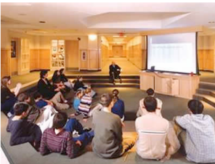
Ilustración 19. Actividad docente - Ipswich School, EEUU

La obsoleta praxis de la enseñanza descrita en la cita precedente debe reemplazarse por un repertorio mucho más sugerente, versátil y progresista. En efecto, esta pareja de diseñadores norteamericanos ponen sobre la mesa la ocasión de que nos planteemos un escenario más amplio, inspirador y prolífico.: “cualquier persona, con cualquier profesor, en cualquier lugar y en cualquier tiempo, aprendiendo cosas distintas”. Aquí reside la verdadera innovación para la Universidad, antes, durante o más allá del EEES.