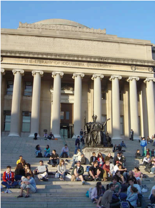
Ilustración 22. Grada frente a la Biblioteca Low de la Universidad de Columbia, Nueva York, EEUU