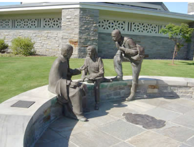
Ilustración 18. Grupo escultórico - Marist College, Poughkeepsie, EEUU