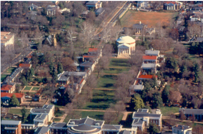
Ilustración 3. Campus central – Lawn. Universidad de Virginia, Charlottesville, EEUU

“No se puede excluir la idea de que el campus americano sea el resultado de un proceso racional y autónomo de formalización de la idea abstracta de la sociedad democrática”. (Bitonto & Giordano, 1995)