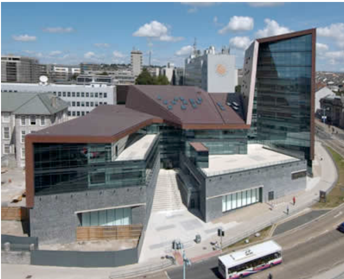
Ilustración 16. Edificio Roland Levinski de la Universidad de Plymouth, Reino Unido