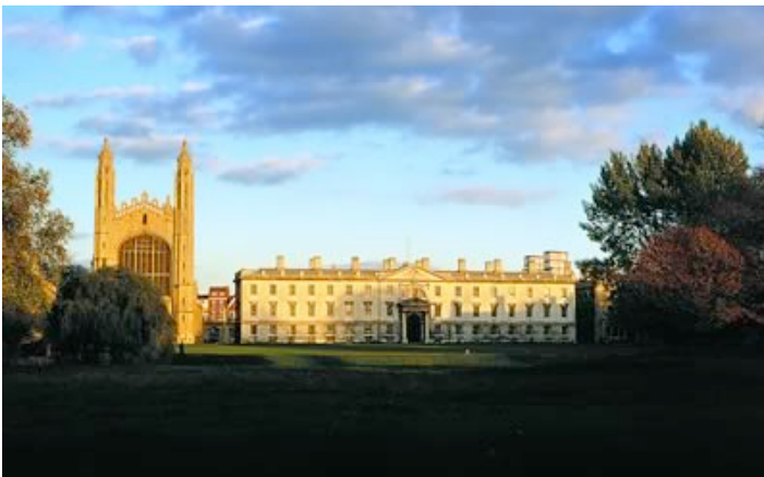
Ilustración 27. King’s College de la Universidad de Cambridge, Reino Unido

La Educación es un hecho espacial. Por tanto, y como colofón, la transformación de los campus y edificios de las universidades al EEES han de pensarse, planificarse y ejecutarse sin perder de vista esta trascendental condición, que viene soportando desde hace siglos la excelencia de la formación integral del ser humano..., que es su verdadera misión.