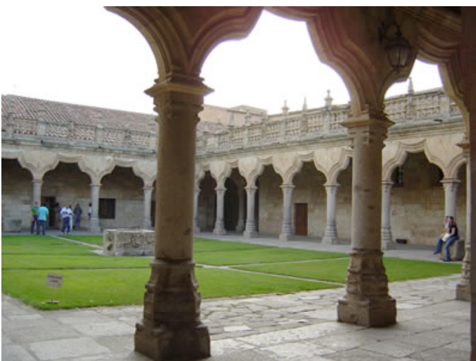
Ilustración 7. Patio de Escuelas Menores de la Universidad de Salamanca, España

En Europa, la universidad ha sido históricamente sinónimo de ciudad, y no tendría sentido pensar en un futuro común para los países integrantes que no rindiera tributo a semejante seña de identidad secular, previa su necesaria actualización conforme a las circunstancias contemporáneas. El complejo universitario de origen centroeuropeo nace en la ciudad y de esta extrae sus motivos más válidos de subsistencia (Rebecchini, 1981).