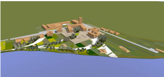
Ilustración 10. Perspectiva desde el Oeste - Nuevo Campus de Villamayor de la Universidad de Salamanca, España