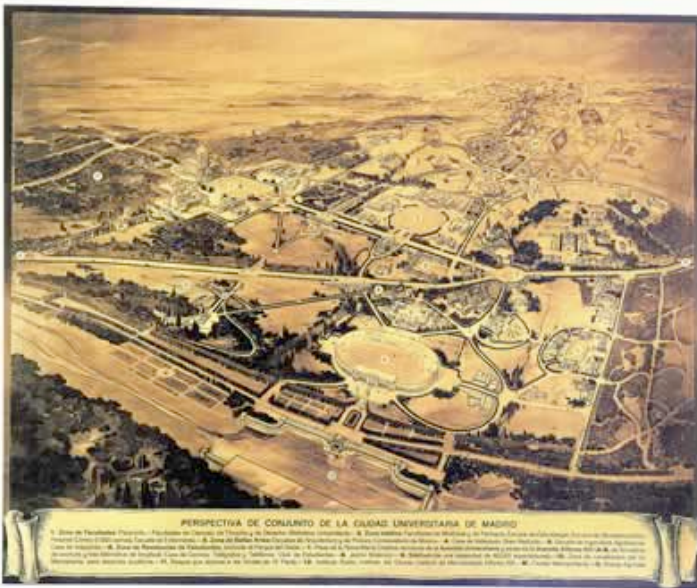
Ilustración 24. Perspectiva Ideal, 1928. Ciudad Universitaria de Madrid, España

“En los momentos actuales, España vuelve a plantearse, como en 1927, el modelo de Universidad que le conviene. Entre las disensiones no parece adivinarse una Idea capaz de impulsar lo que hoy identificamos en la excelencia, con la contundencia necesaria como para proponer de nuevo la Utopía. Falta probablemente en nuestro tiempo la autoridad moral suficiente. O quizás la poesía capaz de ponernos en marcha asumiendo los riesgos de perder posiblemente lo que, de momento, «nos conviene»”. (Baldellou, 2002)