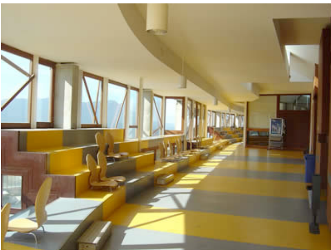
Ilustración 14. Facultad de Ciencias Jurídicas – Campus Lagoas-Marcosende, Universidade de Vigo