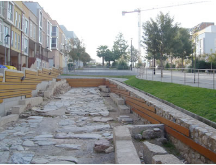
Ilustración 6. Ágora peatonal – Campus Muralla del Mar de la Universidad Politécnica de Cartagena, España