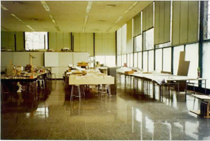
Ilustración 15. Crown Hall - Illinois Institute of Technology, Chicago, EEUU

La faceta didáctica puede identificarse en otros ejemplos de excelencia, análogamente anteriores al EEES, que nos ilustran hoy con toda su energía, como es el caso del Crown Hall del referido IIT. El Crown Hall era el mayor espacio interior que Mies había realizado y aunque lo justificaba como siempre lo había hecho, es decir, diciendo que debido a su misma generalidad siempre se podía adaptar a fines específicos variables, tenía en mente asimismo otro propósito. El edificio era una materialización con formas modernas de la Bauhütte medieval, la logia donde los maestros constructores, los capataces, los obreros y los aprendices se reunían, planeaban, enseñaban y aprendían, todos en común (Schulze, 1986).