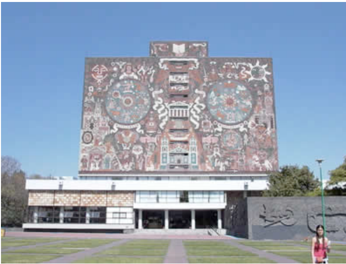
Ilustración 5. Biblioteca de Universidad Nacional Autónoma de México