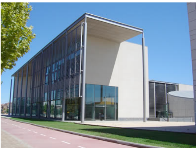
Ilustración 26. Biblioteca del Campus de Cappont de la Universitat de Lleida, España

Es tiempo, pues, de innovar. Atrás deben quedar las arcaicas fórmulas pedagógicas, pero también las estructuras espaciales apáticas. Innovar supone provocar admiración, al atreverse a imaginar soluciones no vistas antes. Si evocamos el pensamiento del maestro Antonio Gaudí, con su bien conocida cita (“La originalidad consiste en el retorno al origen”), la referida innovación quizá pase por el regreso a la esencia del hecho educativo, es decir, a la relación estrecha entre profesor y alumno; en suma, a la virtud intrínseca a la producción y transmisión del Saber.