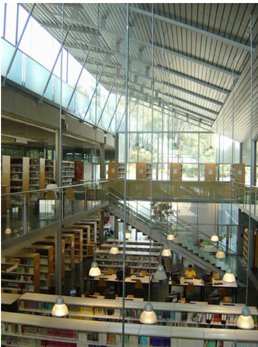
Ilustración 4. Biblioteca del Campus Montilivi de la Universitat de Girona, España

“Los edificios moldean el comportamiento. No se puede hacer plena justicia a la expresión visual de los objetos arquitectónicos tratándolos como perspectivas separadas o independientes, como si sólo existieran para ser observados. Tales objetos no sólo reflejan las actitudes de la gente por la que y para la cual fueron hechos, sino que también informan activamente el comportamiento humano”. (Arnheim, 1978)