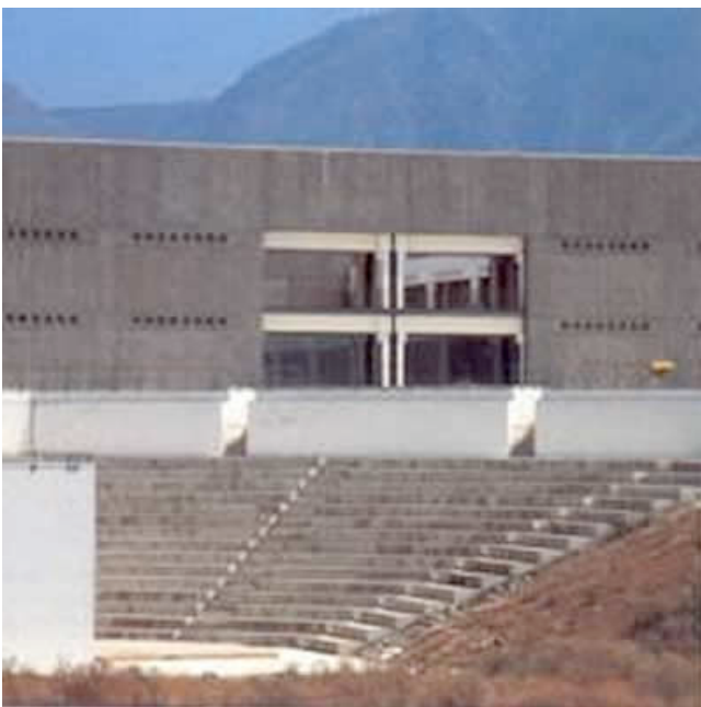
Ilustración 23. Auditorio exterior de la Universidad de Palermo, Italia

En Europa, el Programme on Educational Building (PEB) de la OECD transformó en Enero de 2009 su denominación por la de Centre for Effective Learning Environments (CELE). El cambio de denominación se fundamenta en un principio estrechamente ligado a nuestra propuesta del “Campus Didáctico”. La OECD se suma a la línea investigadora que desde hace tiempo vienen trazando educadores y arquitectos, convencidos de que el progreso pasa por asumir que el aprendizaje ya no se circunscribe exclusivamente al aula convencional, sino que invade ámbitos que hasta ahora habían permanecido indiferentes en el proceso educativo.