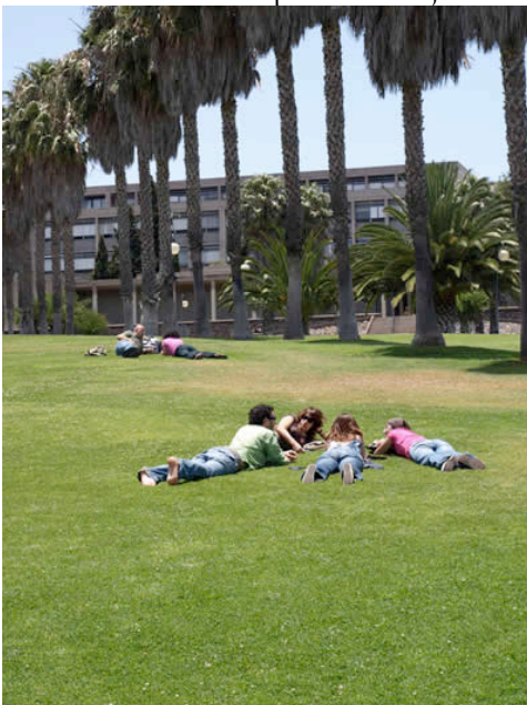
Ilustración 21. Campus de Guajara de la Universidad de La Laguna, España

La aplicación en la Universidad de esta política de “reinención” podría acarrear que se activaran como lugares potencialmente estimuladores de la transmisión del Saber medios y estancias que hasta ahora han permanecido infrautilizados a estos efectos; a la escala del campus, cabría citar los espacios libres naturales o de intervención (zonas ajardinadas), auditorios o gradas abiertas, residencias y equipamientos asociados, edificios o locales de alumnos, así como lugares alternativos (restauración, áreas wi-fi, exposiciones culturales exteriores, etc), o el CRAI; a la escala de edificio, la entrada, pasillos y comunicaciones internas (“calle didáctica”), despachos, áreas de ocio y descanso o salas de alumnos, entre otros posibles.