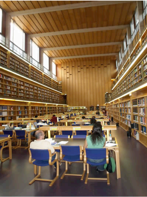
Ilustración 17. Biblioteca del Campus de Tafira de la Universidad de Las Palmas de Gran Canaria, España