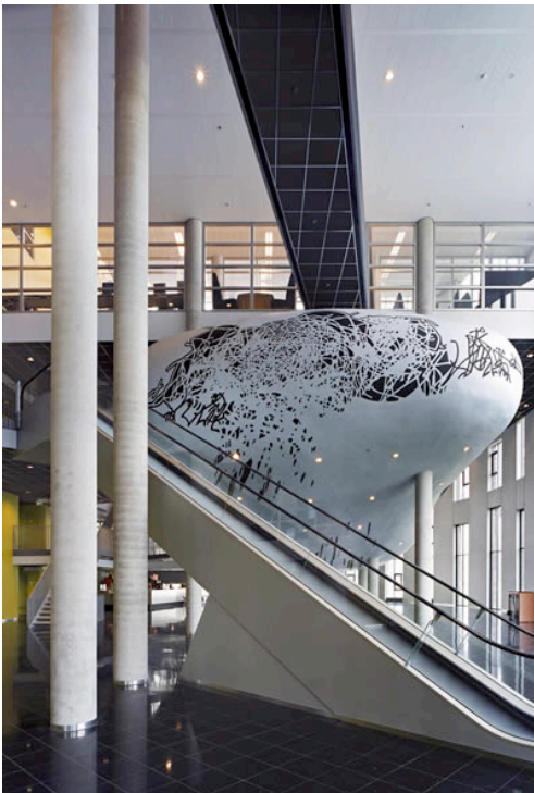
Ilustración 13. OZW-School of Health de la Universidad UV, Amsterdam, Holanda

En tercer lugar, el edificio, que debe abandonar su papel como mero contenedor de aulas, para resolverse mediante soluciones imaginativas y didácticas. Son recomendables muchos de los contenidos de Designshare-Forum for Innovative Schools, organismo internacional que fomenta ideas-fuerza como el “edificio-libro de texto tridimensional”. Ejemplos en esta línea son el Educatorium (Koolhaas, Utrecht, 1997), el School of Art&Design (CPG, Singapur, 2007), el edificio OZW-School of Health de la UV University (Dekkers, Amsterdam, 2006) o, en nuestro país, la Facultad de Ciencias Jurídicas de la Universidade de Vigo, cuya “calle educadora” interior engarza los diversos ámbitos áulicos a su paso, convirtiéndose en un “ágora” longitudinal, completamente distinta al pasillo convencional.