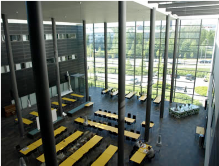
Ilustración 2. Campus Arcada de la University of Applied Sciences, Finlandia