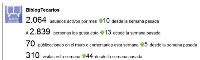
Figura 3. Estadísticas de las redes sociales de BiblogTecarios en Facebook

Página de fans creada próxima a la fecha de inauguración del portal, en octubre de 2010. Desde la página y por medio de la aplicación RSS Graffiti los post del portal se publican automáticamente.