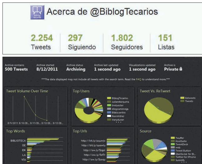
Figura 2. Estadísticas de las redes sociales de BiblogTecarios en Twitter

El perfil fue creado el 20 de julio de 2010, pero su primer tweet no se publicó hasta el 17 de septiembre, fecha en que se empezó a anunciar en qué consistía el nuevo proyecto. Twitter es una de las redes sociales más utilizadas y, gracias a las menciones y retweets, la plataforma está teniendo una mayor difusión. A día de hoy el perfil refleja unas interesantes cifras que día a día van en aumento (figura 2).