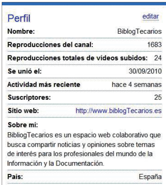
Figura 4. Estadísticas de las redes sociales de BiblogTecarios en YouTube

Canal de vídeos, en el que se enlazan o marcan como favoritos aquellos que se consideran más interesantes y/o divertidos sobre el campo de la biblioteconomía y la documentación. El canal fue creado en octubre de 2010.