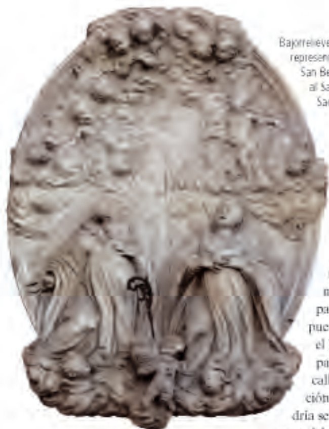
Bajorrelieve en fachada que representa a San Benito y San Bernardo adorando al Santísimo Sacramento.

En la maqueta de León Gil de Palacio, el monasterio del Santísimo Sacramento está representado con total minuciosidad. Podemos apreciar la cúpula de la iglesia y la tapia que lo separa el jardín arbolado de la plaza de la Cruz Verde