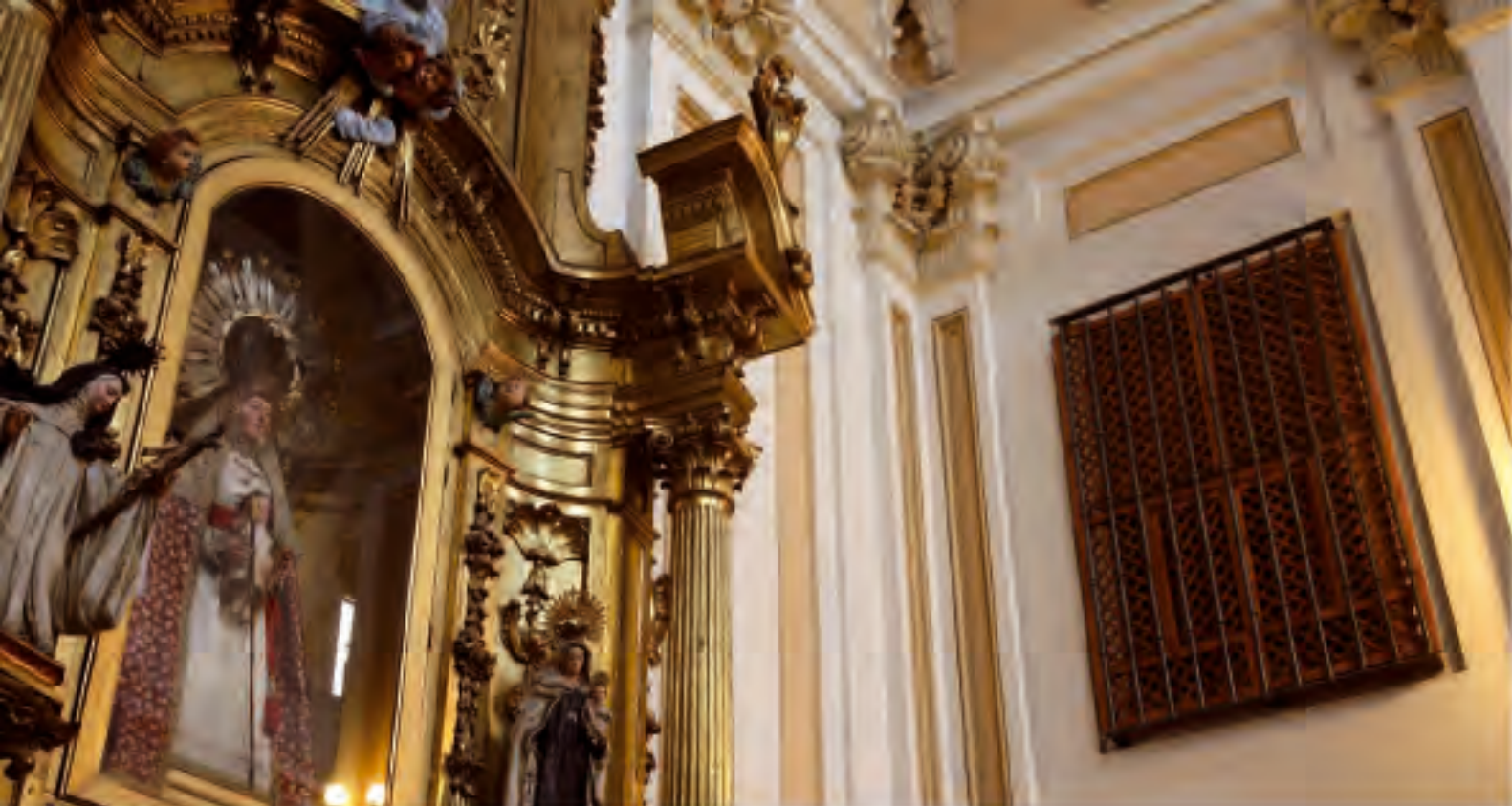
En el crucero, al lado de la Epístola se encuentra el altar de Nuestra Señora del Patrocinio de la época de Fernando VII. Junto a ella, detalle de una ventana con celosía que comunicaba con la antigua clausura.

guna y de Pedro Martínez, escribano del número y mayor de Ayuntamiento, y el mismo día dejó la misa el cardenal Moscoso y luego el día de San Ildefonso trabajaron con licencia del señor Nuncio y asistió el Duque de Uceda y el de San Germán a la mudanza y a todo».