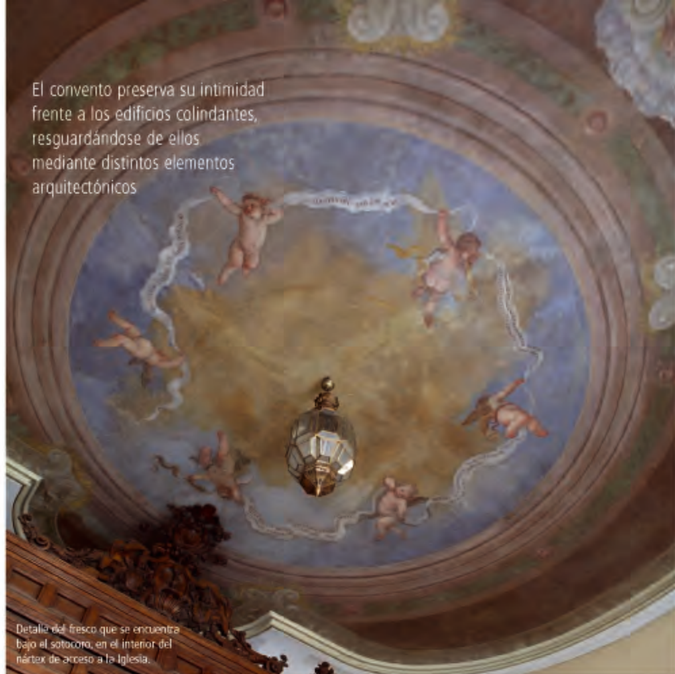
Detalle del fresco que se encuentra bajo el sotocoro, en el interior del nártex de acceso a la Iglesia.

El convento preserva su intimidad frente a los edificios colindantes, resguardándose de ellos mediante distintos elementos arquitectónicos