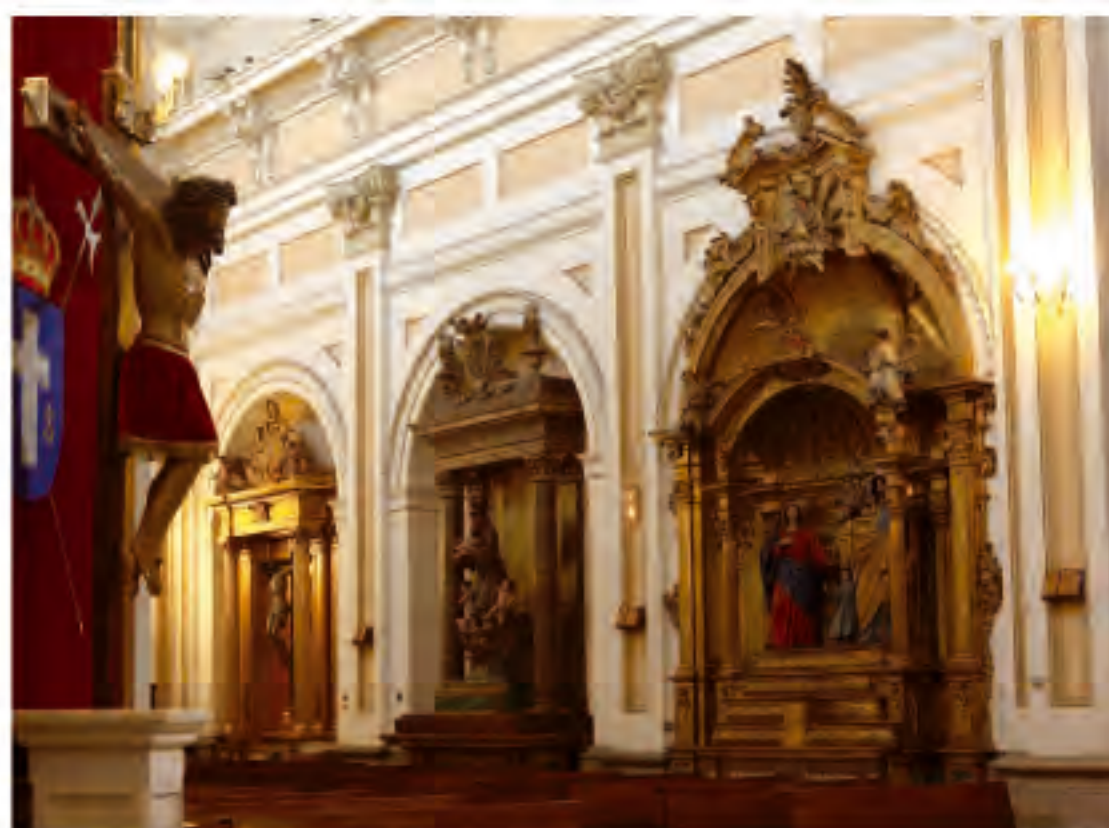
Interior de la iglesia. Detalle de las capillas de la nave principal.

La desamortización de Mendizábal (1836), no afectó a nuestro convento que sin embargo en 1839 vendió la zona de residencia de las monjas que se había construido en 1725 a la familia Lezcano que lo convirtió en su residencia hasta el año 1944, año en el que fue vendido y sus viviendas desalojadas sucesivamente. En 1976 y en estado ruinoso, el Palacio Lezcano fue comprado por el Ayuntamiento de Madrid que lo reestructuró totalmente el edificio para convertirlo en sede de la Delegación de Hacienda.