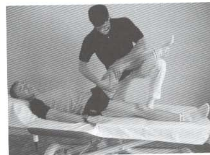
Masaje de movilización articular

Si aparecen zonas del tejido conjuntivo cerca de las fascias y con trastornos musculares e incluso articulares, puede combinarse el Masaje del tejido conjuntivo con el Masaje de movilización articular y ejercicios activos isométricos.