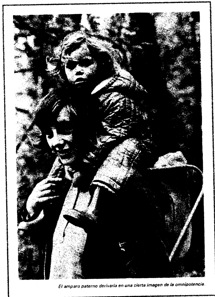
El amparo paterno derivaría en una cierta imagen de la omnipotencia.