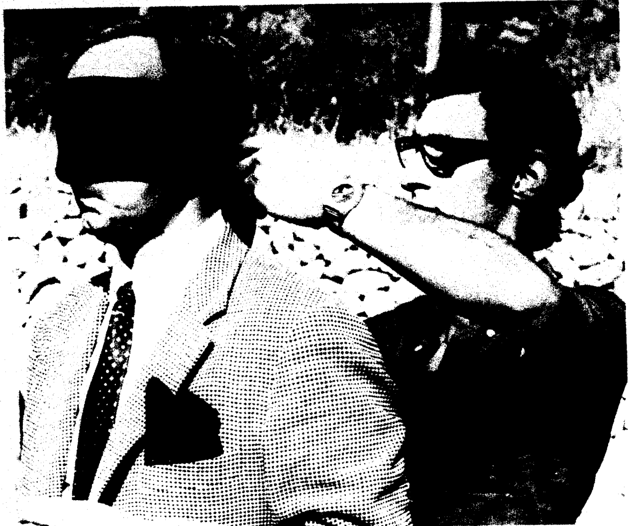
La teoría freudiana se tapa los ojos, de antemano y por principio, ante la realidad religiosa.

Conviene por esto penetrar, siquiera un poco, en las paradojas que el narcisismo ofrece a la interpretación freudiana de la religión.