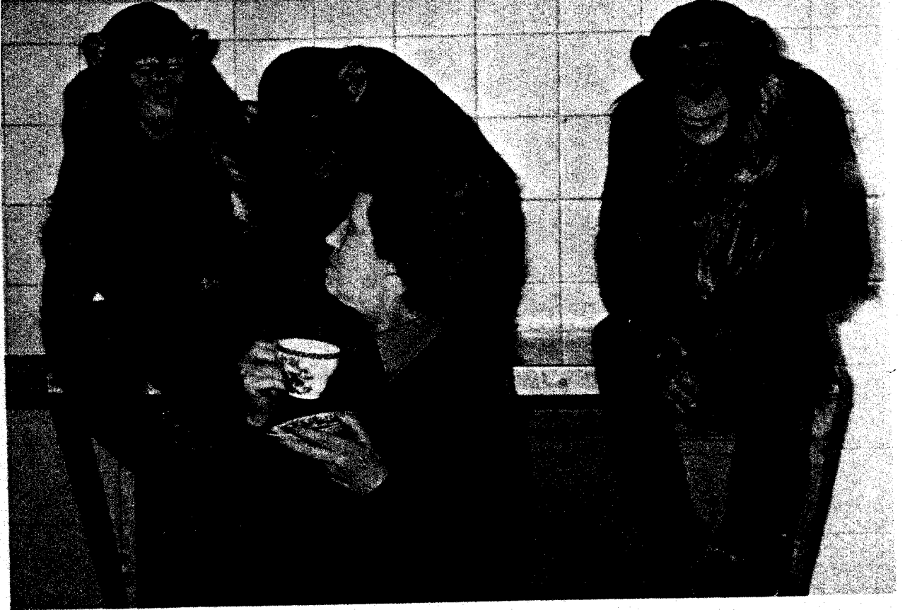
Las influencias del evolucionismo se muestran acusadísimo en Freud.

El modelo que ha querido substituir a la realidad, y rehacerla, no consigue atenuar en el hombre la huella de Dios, origen y fin de la criatura, Causa Primera a la que se remiten todos sus efectos.