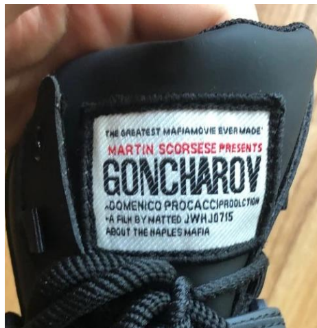
Figura 1. Etiqueta de unas botas de imitación que dio origen al fenómeno Goncharov

Fuente: Zootycoon, 2020, en Wiki Fandom Goncharov, 2024.