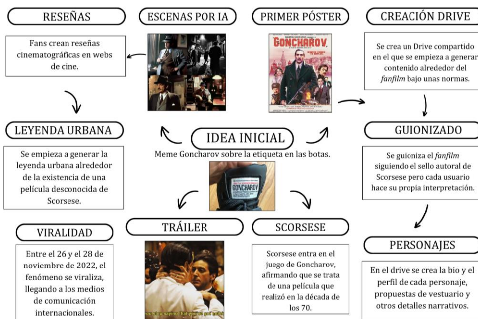
Figura 3. Evolución del universo narrativo transmedia de Goncharov

El concepto central del fenómeno y desde el que surgen todas las creaciones posteriores es el de la existencia de una película de mafia llamada Goncharov , avalada por Martin Scorsese y dirigida por el desconocido director Matteo JWHJ 0715, gracias a una bota y una publicación en Tumblr. De este concepto surgen varias líneas independientes como son el primer póster que aporta, además, el elenco actoral, escenas generadas por un usuario con la ayuda de la IA que permite dar forma visual y estética a la idea y, en tercer lugar, la publicación de contenido creado por diferentes usuarios que habilita la expansión y profundidad de la narrativa. A continuación, se muestra una infografía sobre la evolución del universo narrativo transmedia de Goncharov :