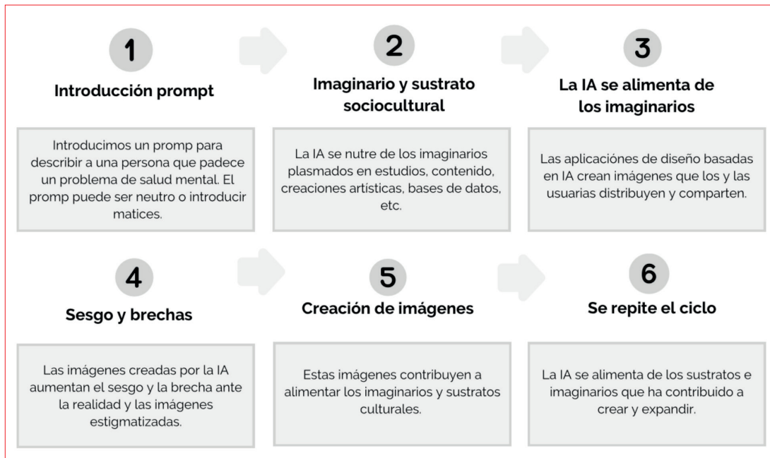
Figura 4. Infografía sobre el ciclo sesgo y brecha a través del diseño GenAI.

ciones usadas y en cada uno de los problemas de salud mental recreados visualmente. Sin embargo, existen una serie de elementos, variables y características que son comunes o mayoritarias. En primer lugar, en 53 de las 54 imágenes la persona afectada está representada en soledad y solo en una fotografía está acompañada por otra persona, concretamente por una doctora, aunque la persona acompañada parece estar en una cárcel o habitación con rejas, lo cual también hace que la única excepción sea bastante singular en este sentido. Otro resultado a destacar es que existe cierta tendencia a que la persona representada sea una mujer joven, mientras que los hombres solo aparecen en 15 imágenes de 54, aunque cabe señalar que en 11 imágenes no se puede determinar el sexo de la persona representada. En cuanto al tipo de raza, no hay representación de todas las razas, en solo 2 imágenes hay personas que podrían considerarse afroamericanas, no hay ninguna representación asiática, la gran mayoría de los representados parecen ser caucásicos. Respecto al rango de edad, sí existe más variedad, aunque el rango entre los 20 y 25 años es el más común, mientras que no hay representación de menores.