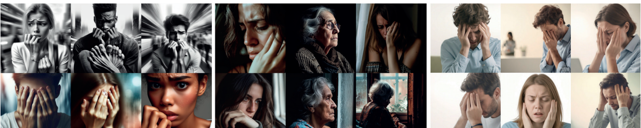
Figura 3 . La ansiedad según la IA. Fuente: Dall-E, Midjourney y SDT (febrero, 2024).