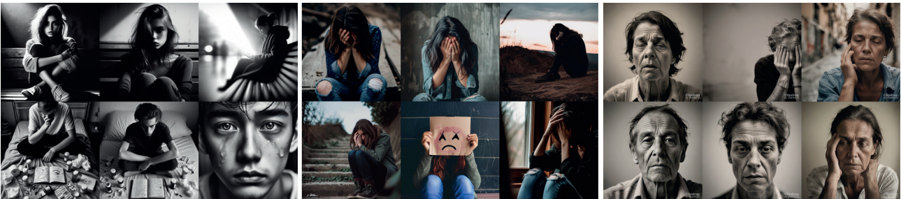
Figura 2. El trastorno de depresión mayor según la IA.