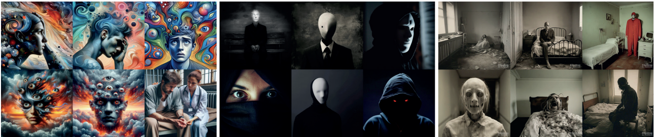
Figura 1. La esquizofrenia paranoide según la IA.