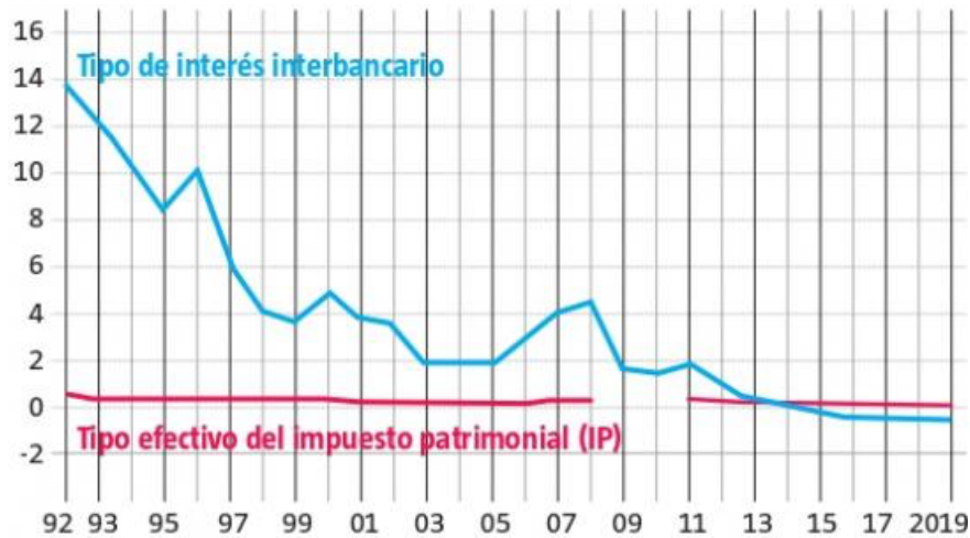
Tabla 4. Tipo de interés interbancario de referencia y el tipo efectivo del IP (en porcentaje).