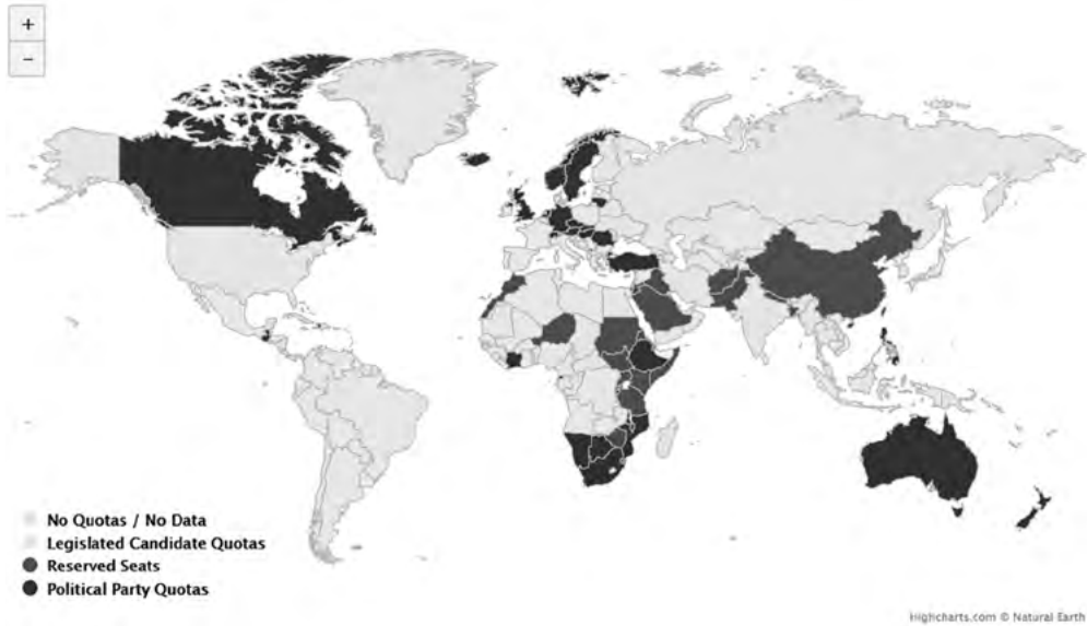
Mapa 1. Cuotas electorales en el mundo, 2019.