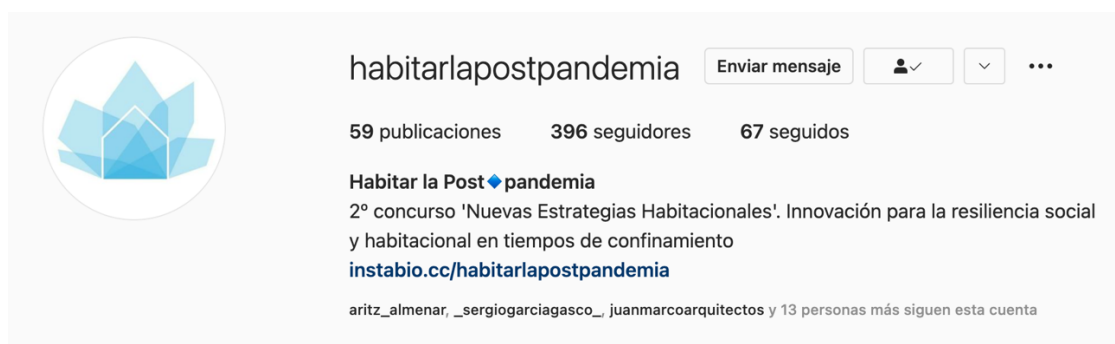
Fig. 8 Captura de pantalla de la cuenta Habitar la post-pandemia de Instagram

La comunicación oficial de la documentación del concurso se gestionó a través de la Cátedra Innovación en Vivienda de la Universitat Politècnica de València (Cátedra Habitatge), y paralelamente con publicaciones en la red social Instagram, en la cuenta #habitarlapostpandemia, alcanzando esta última 396 seguidores.