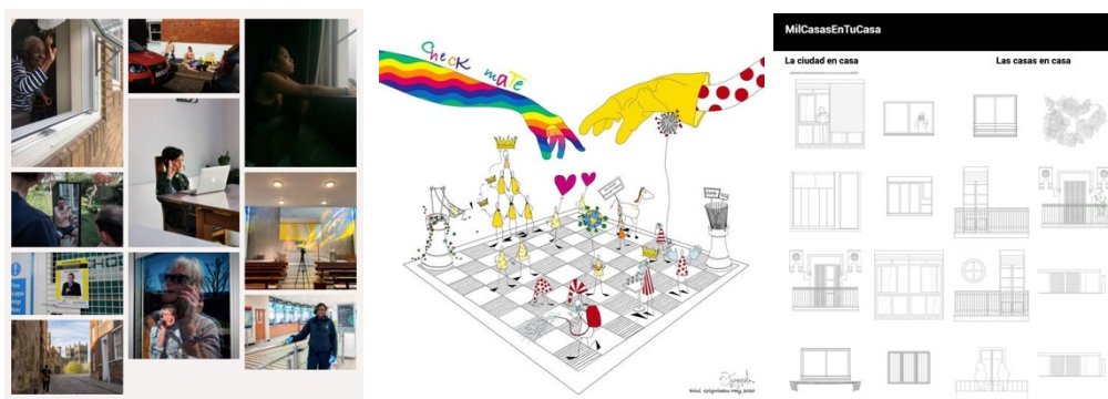
Fig. 2 Cartografías de la pandemia de la COVID-19 (‘picturing lockdown’ / A-place / Mil casas en tu casa)

Poco después, y como resultado de la situación de confinamiento extrema vivida, no sólo en España sino en otros muchos países, empezaron a surgir distintas iniciativas de índole artística también desde la disciplina arquitectónica— con la voluntad de cartografiar lo que estaba sucediendo. Tal es el caso de ‘Picturing Lockdown’, un proyecto participativo emprendido en torno a la muestra de fotografías que documentaron la experiencia de confinamiento durante la pandemia de la COVID-19. 1 De modo similar, pero con un objetivo dirigido al espacio arquitectónico, las universidades integrantes del proyecto europeo ‘A-Place’ lanzaron un concurso para recoger expresiones artísticas e interdisciplinarias (fotografías, videos, montajes...) que desarrollasen una perspectiva creativa sobre el lugar y tiempo del confinamiento. 2 La plataforma del colectivo ‘Arquitectos de Cabecera’ recogió en su web bajo el título ‘mil casas en tu casa’ un rico catálogo de situaciones vividas en los hogares que ponían de manifiesto, no solamente los nuevos usos que se daban ahora en los interiores, sino también las ingeniosas soluciones adaptativas que sus habitantes ponían en práctica (figura 2). 3