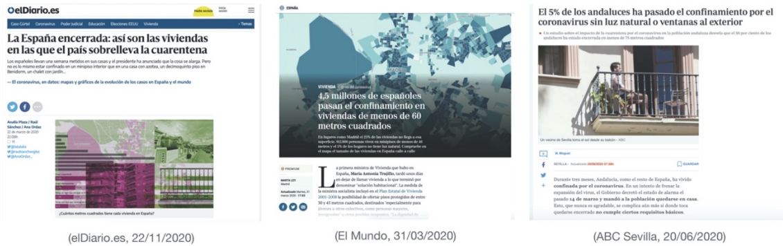
Fig. 1 Titulares de prensa con información estadística sobre el parque residencial en España

Poco después, y como resultado de la situación de confinamiento extrema vivida, no sólo en España sino en otros muchos países, empezaron a surgir distintas iniciativas de índole artística también desde la disciplina arquitectónica— con la voluntad de cartografiar lo que estaba sucediendo. Tal es el caso de ‘Picturing Lockdown’, un proyecto participativo emprendido en torno a la muestra de fotografías que documentaron la experiencia de confinamiento durante la pandemia de la COVID-19. 1 De modo similar, pero con un objetivo dirigido al espacio arquitectónico, las universidades integrantes del proyecto europeo ‘A-Place’ lanzaron un concurso para recoger expresiones artísticas e interdisciplinarias (fotografías, videos, montajes...) que desarrollasen una perspectiva creativa sobre el lugar y tiempo del confinamiento. 2 La plataforma del colectivo ‘Arquitectos de Cabecera’ recogió en su web bajo el título ‘mil casas en tu casa’ un rico catálogo de situaciones vividas en los hogares que ponían de manifiesto, no solamente los nuevos usos que se daban ahora en los interiores, sino también las ingeniosas soluciones adaptativas que sus habitantes ponían en práctica (figura 2). 3