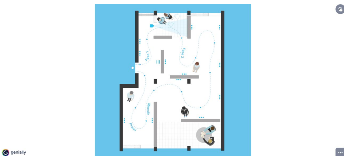
Fig. 7 Captura de pantalla de exposición virtual Habitar la post-pandemia

En un tercer nivel, finalizadas ambas fases del concurso, y con los premios concedidos, la iniciativa ‘Habitar la Post-Pandemia’ concluyó con el retorno a la sociedad de la experiencia realizada. Por una parte, se inauguró una exposición virtual de los trabajos (tanto de los seleccionados en la primera fase, como de los premiados finalmente en la segunda) a modo de difusión de la propuesta. La exposición se organizó, con un guiño que la virtualidad permitía, como un recorrido expositivo por la propia vivienda soporte del trabajo del concurso en el Grupo Virgen del Carmen de València. La muestra se puede ver en la dirección: https://view.genial.ly/5fec678ba666f40d7dc6ef10/interactive-image-habitar-la-postpandemia