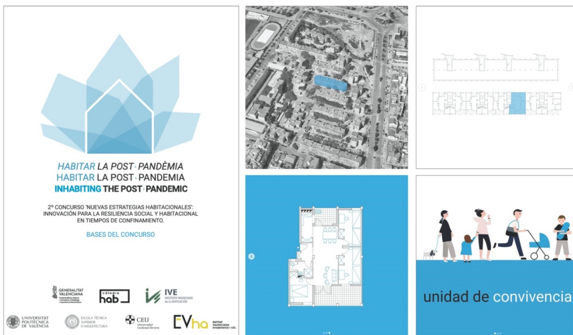
Fig. 4 Imágenes del concurso 'Habitar la post-pandemia'. (Diseño gráfico: Julia Martínez Villaronga)

La idea del concurso se materializó con la concesión de las ayudas publicadas por la Cátedra Innovación en Vivienda de la Universitat Politècnica de València (Cátedra Habitatge), como una oportunidad para contribuir a estas reflexiones acerca del estado de la vivienda actual. Se propuso entonces una actividad que tratase de visualizar el panorama de los hogares de la Comunitat Valenciana ante la situación de pandemia de la COVID-19. Su objetivo fue doble: obtener un repositorio visual de las problemáticas, y encontrar un catálogo de soluciones concretas de innovación de las viviendas para la mejora de la resiliencia habitacional. Así, se persiguió el paso de una reflexión introspectiva sobre la situación de confinamiento vivida a una proyección de la problemática en un contexto determinado, y todo ello observado desde la perspectiva de los estudiantes de las escuelas de arquitectura que vivieron la situación de confinamiento en la Comunitat Valenciana.