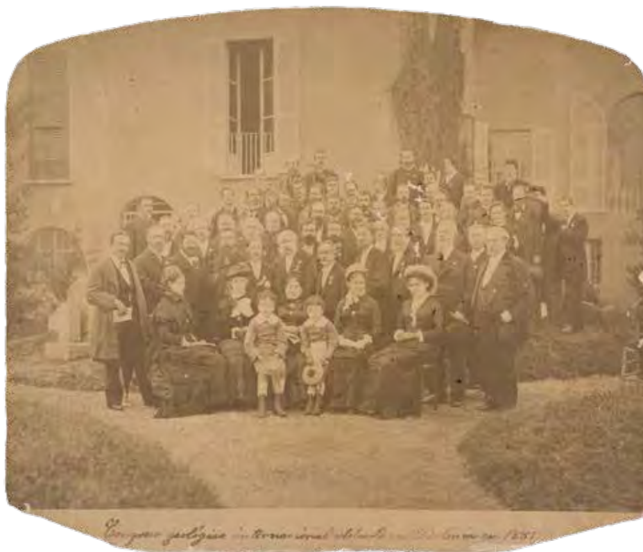
Figura 4. Fotografia de grup dels participants al II Congrés Geològic Internacional (Bolonya, 1881) / Fotografía de grupo de los participantes en el II Congreso Geológico Internacional (Bologna, 1881) FDJV-MPV