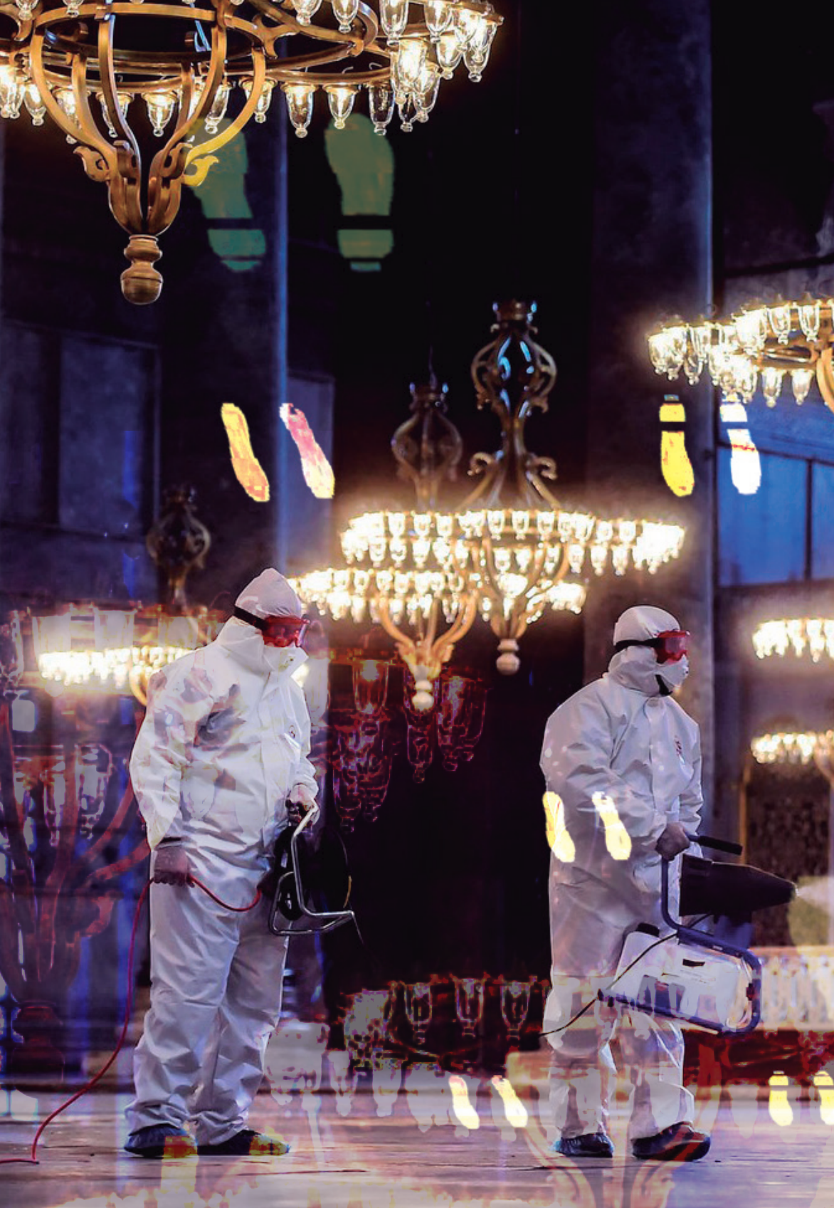
Desinfección de la mezquita de Santa Sofía en Estambul, Turquía.