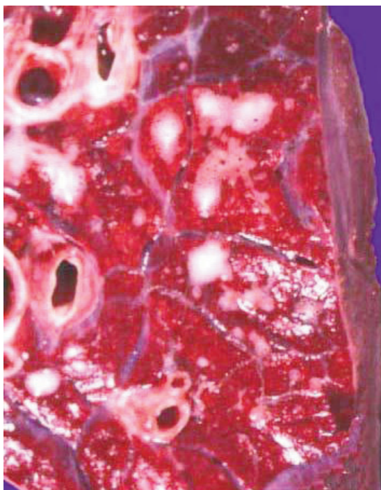
Figura 3. Sección transversal de lóbulo pulmonar con lesión de tipo bronconeumonía supurativa. Figure 3. Transverse section of pulmonary lobe with suppurative bronchopneumonia lesion.

La información se procesó estadísticamente con IBM-SPSS®v25.0 (IBM, Armonk, New York, USA), mediante la prueba de chi-cuadrado y análisis de regresión logística.