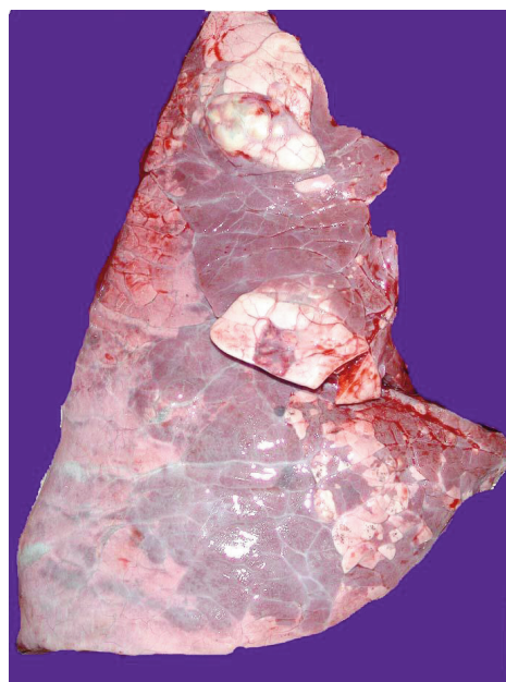
Figura 2. Pulmón con lesión de tipo bronconeumonía supurativa. Figure 2. Lung with suppurative bronchopneumonia lesion.

Se analizaron un total de 251 canales en diferentes salas autorizadas para el desollado de los animales tras el festejo (Real Decreto 260/2002, de 8 de marzo). De estas, 87/251 presentaron algún tipo de lesión verdadera o agónica.