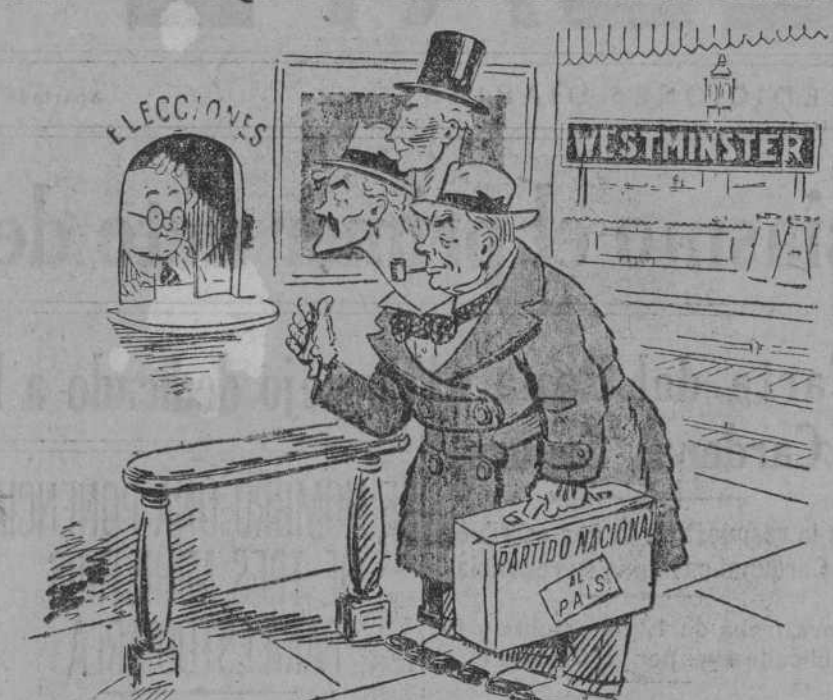
—Un billete de ida y vuelta, haga el favor.