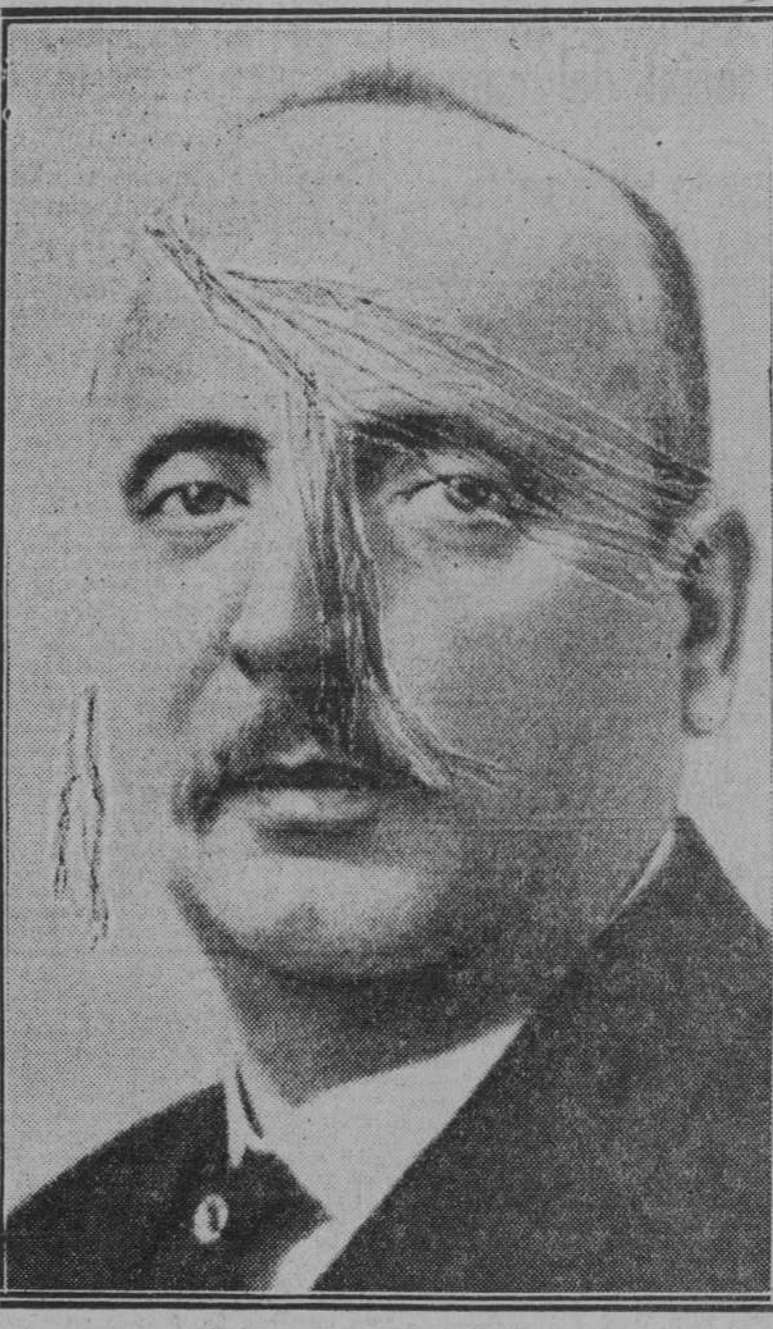
Wilhelm Miklas, que ha sido relegado para la presidencia de la República austriaca

Los vasconavarros y los agrarios Ayer celebraron una reunión las minorías vasco-navarra y agraria para examinar las características del debate sobre la cuestión religiosa.