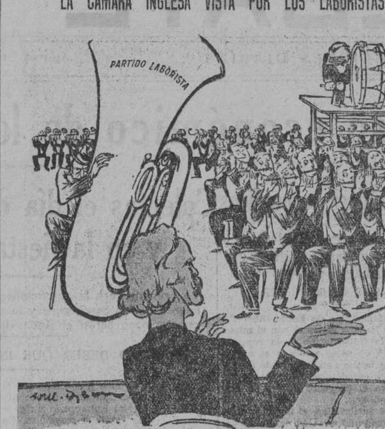
LOS PRIMEROS COMPASES