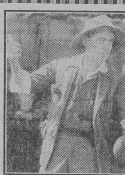
Una escena del "film" Metro Goldwyn Mayer "Trader Horn" (La película milagro), próxima a estrenarse en Madrid