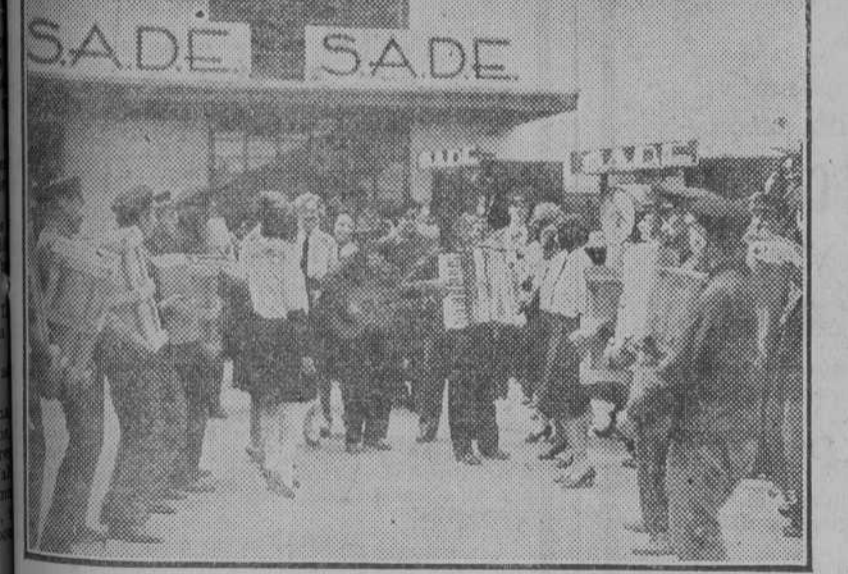
Una escena del "film" UFA "El trío de la bencina", que se estrena mañana en el Palacio de la Música

Un gato negro es el eterno compañero de MARLENE DIETRICH