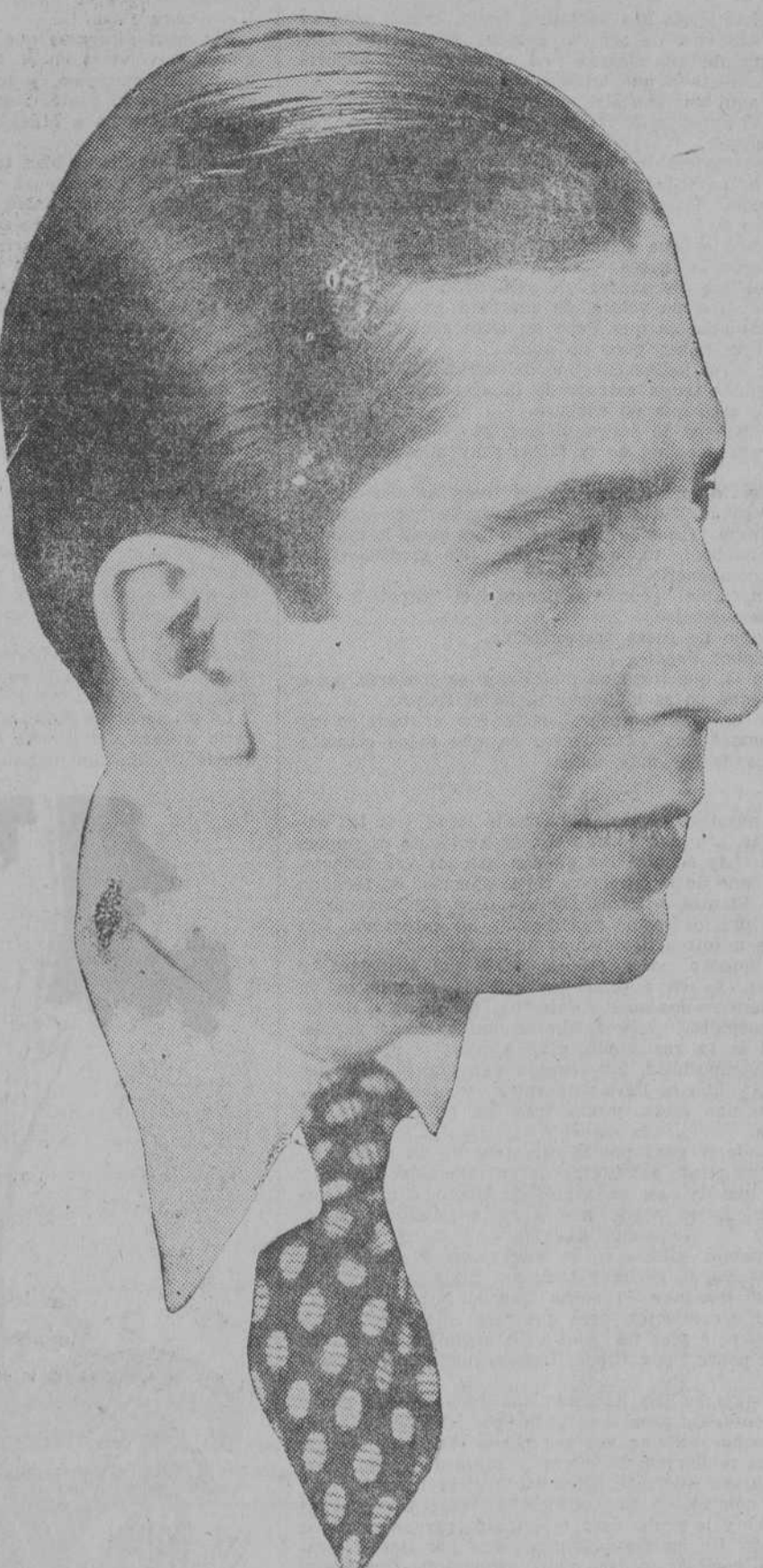
Carlos Gardel es el protagonista de la magnífica producción Paramount "Luces de Buenos Aires" que mañana se estrena en Rialto...

La Prensa ha dicho de esta película: "Todos cuantos habían del cine..."