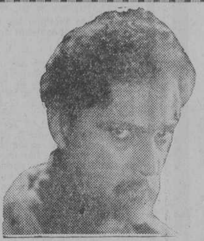
Wladimir Gaidarov, en su gran caracterización de la superproducción "Rasputin"...

El ambiente típico argentino sirve de tema a esta película editada en Juville por "Paramount".