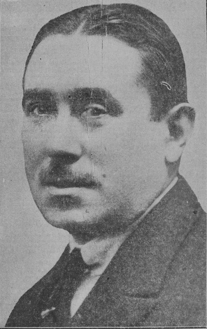
Don Joaquín Turina, ilustre maestro compositor y crítico musical de EL DEBATE, que fué obsequiado anoche con un banquete por su reciente nombramiento de profesor del Conservatorio