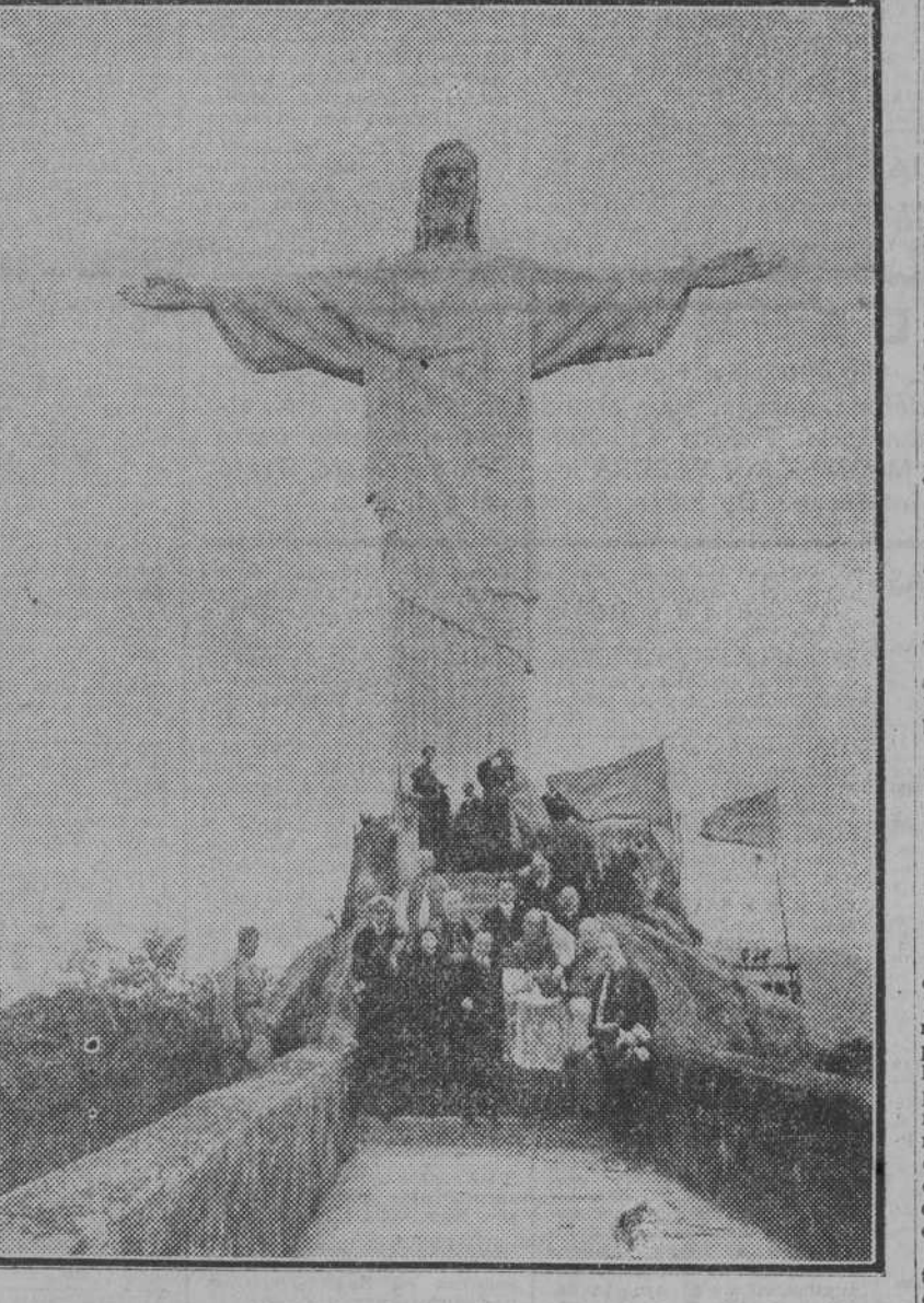
Este monumento grandioso se yergue en el Pico de Torcovado. Mide 40 metros de altura. Su construcción fué costeada por suscripción pública, que organizó el propio Gobierno brasileño. En el acto de la inauguración Marconi iluminó la estatua desde Roma