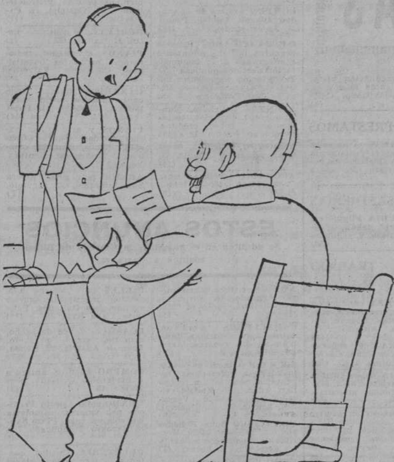
—Aquí pone calamares y dice usted que no hay; pido merluza, y tampooco; ¿lenguados? —No quedan. —¡Vaya!; Otra carta apócrifa!

SEGOVIA, 10.—Ha dejado de publicarse el diario "Segovia Republicana". Realizó una campaña contra la Religión y contra los agrarios, y fué tal el número de bajas que ha tenido que suspender su publicación. Sólo queda en Segovia como diario "El Adelanto de Segovia", propiedad del diputado agrario señor Cano de Rueda. En estos últimos tiempos ha aumentado en grandes proporciones su circulación.