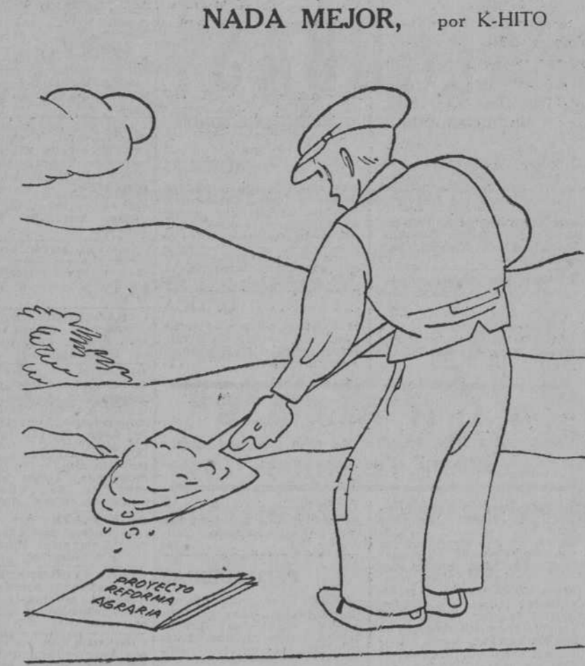
—Bueno; vamos a echarle tierra encima.