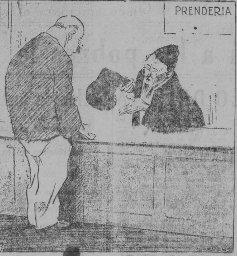
—¿Qué quiere usted por este gorro? Está completamente pasado de moda. ("Kladderatsch", Berlín.)