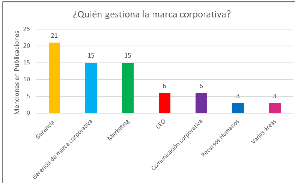
Gráfico 2. ¿Desde qué áreas se debe gestionar la marca corporativa?

Al estudiar las referencias a las áreas de gestión vinculadas a la marca corporativa en el conjunto de los trabajos estudiados, se observa que no todas las publicaciones analizadas mencionan a quién corresponde tal gestión. Sí lo hacen 69 de las 112 publicaciones (ver gráfico 2).