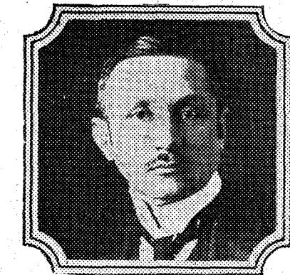
El canciller austriaco Ramek, que ha sido encargado de nuevo de formar Gobierno.