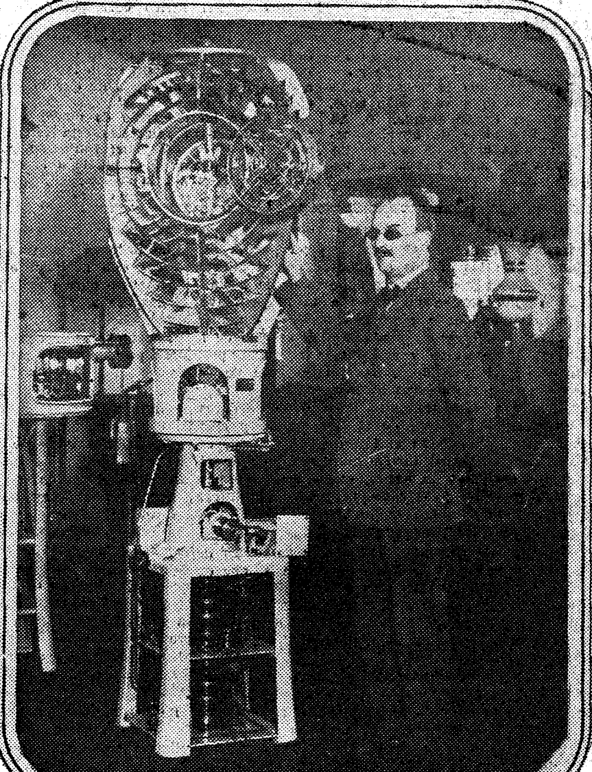
El doctor sueco Gustavo Dolan, a quien se ha otorgado el premio Nobel, por sus invenciones sobre el alambreado. El doctor Dolan perdió la vista durante los ensayos de uno de sus últimos inventos.