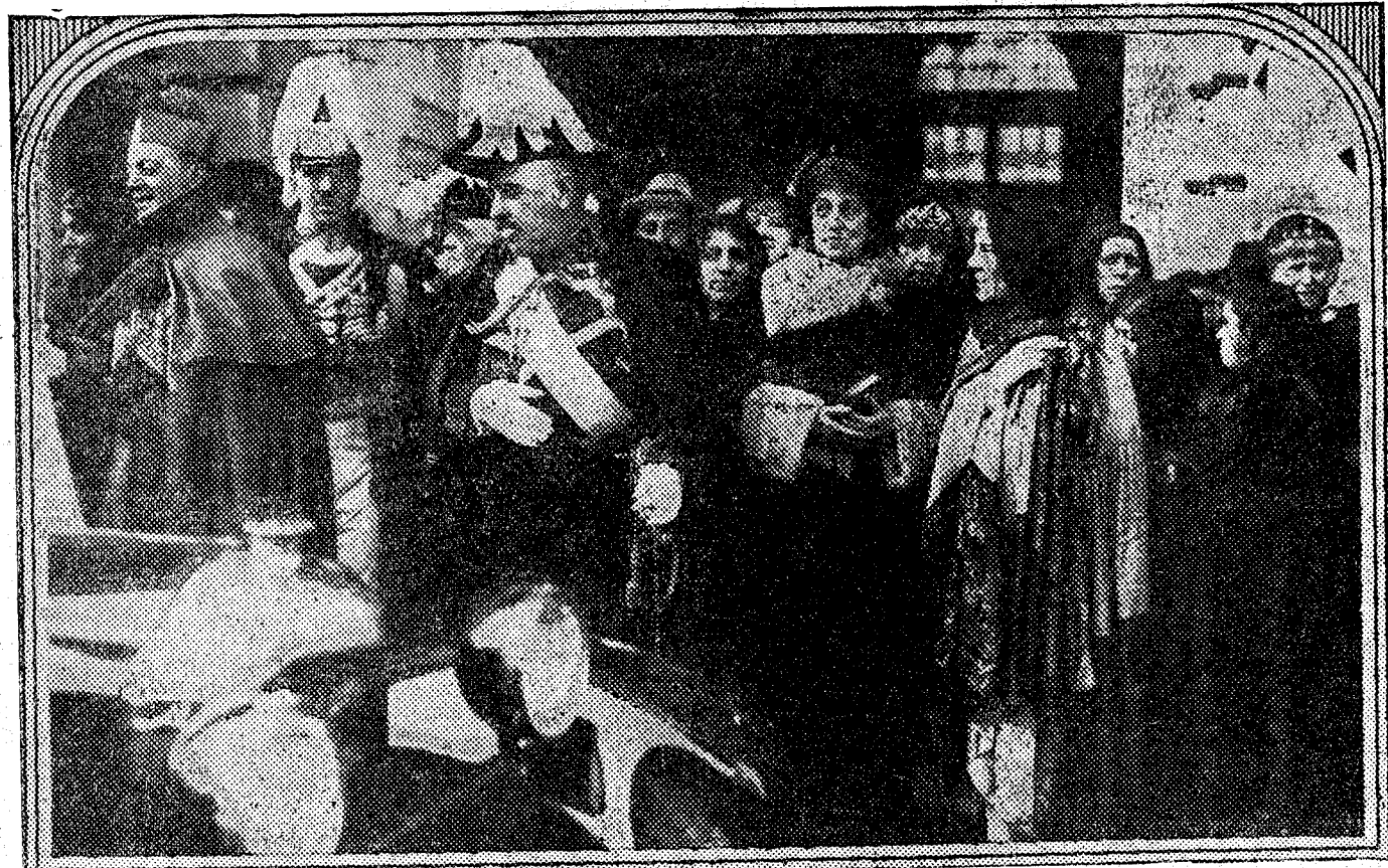
Los grandes de España al salir ayer de Palacio, después de celebrada la capilla pública de la Epifanía