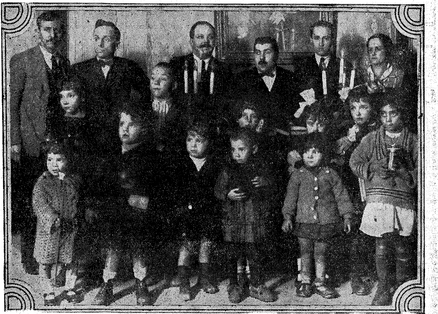
Reparto de juguetes a los niños en el Centro Instructivo y Protector de Ciegos