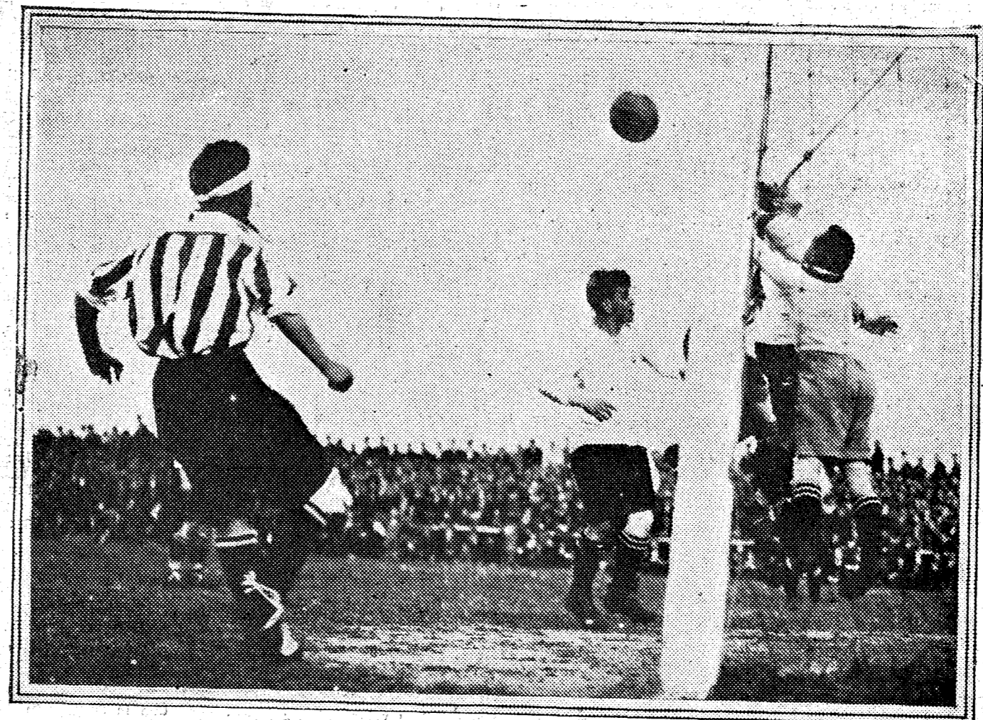
Vidal, del Athletic de Bilbao, rechazando un «corner» de la Real Unión de Irún, en el gran partido jugado en Amute