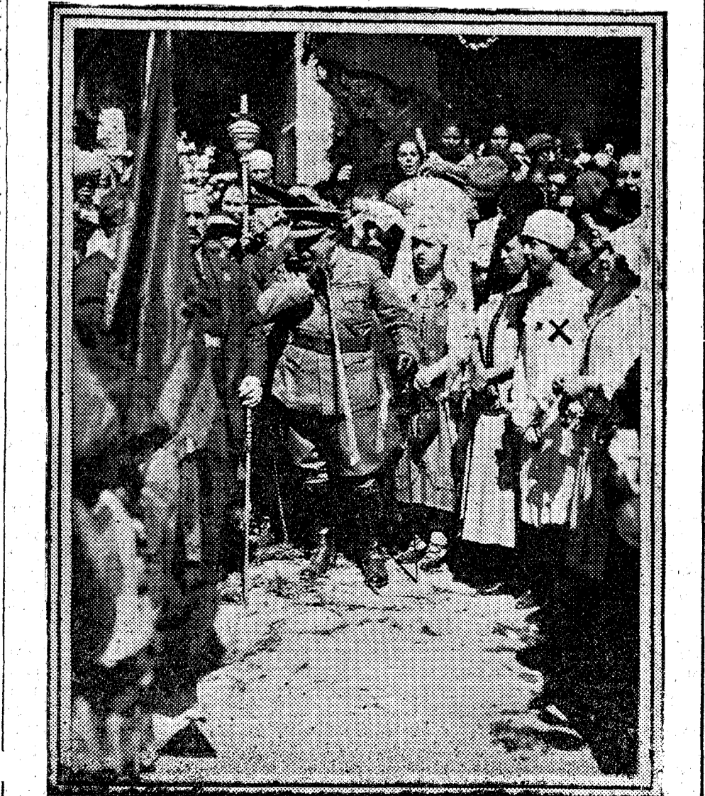
El jefe de los Somatenes, general Flores, pronunciando un discurso, después de la entrega de la bandera al Somatén de Almorox (Toledo), de la que fue madrina la condesa de Güell.