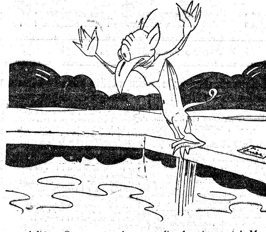
—Adiós, ¡Que no se culpe a nadie de mi muerte! Me suicido porque ya no me hacen caso.