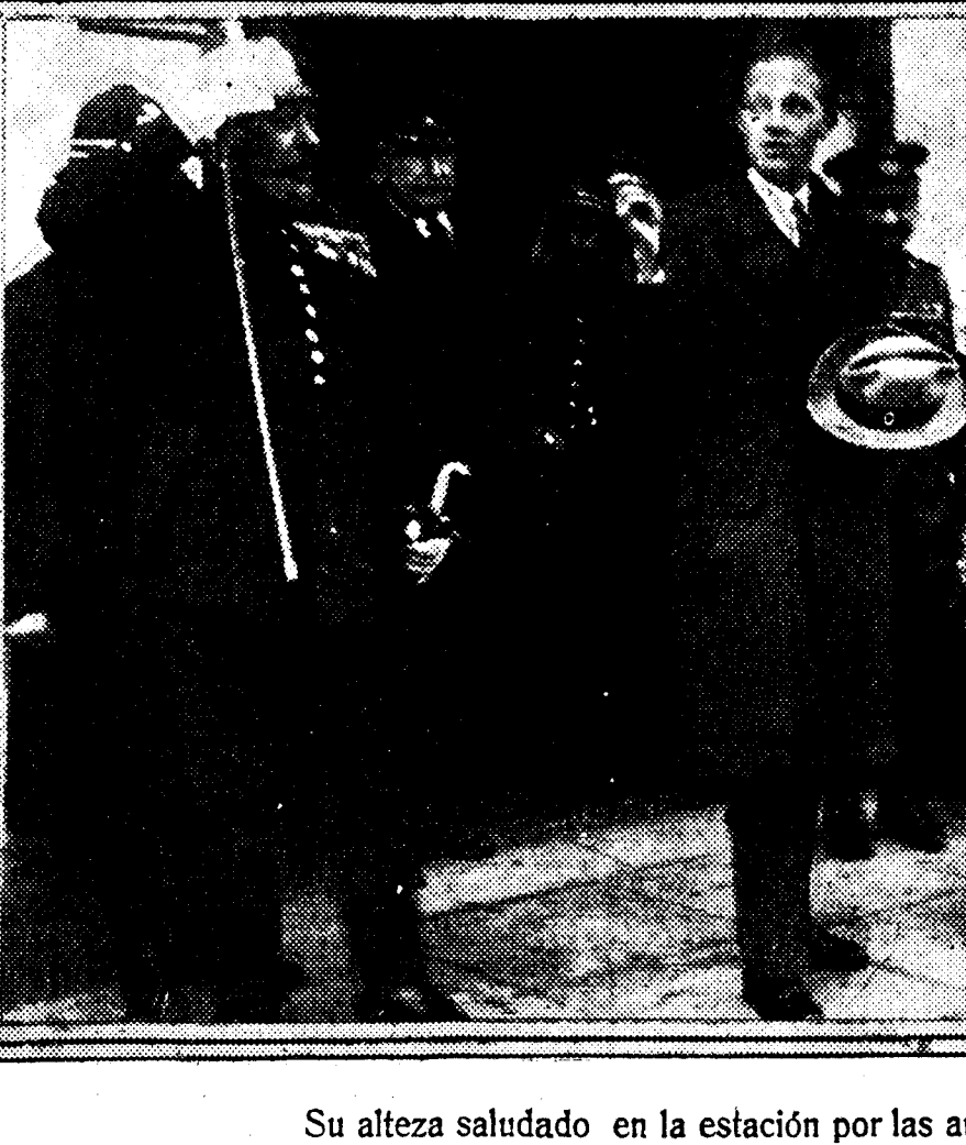
Su alteza saludado en la estación por las autoridades