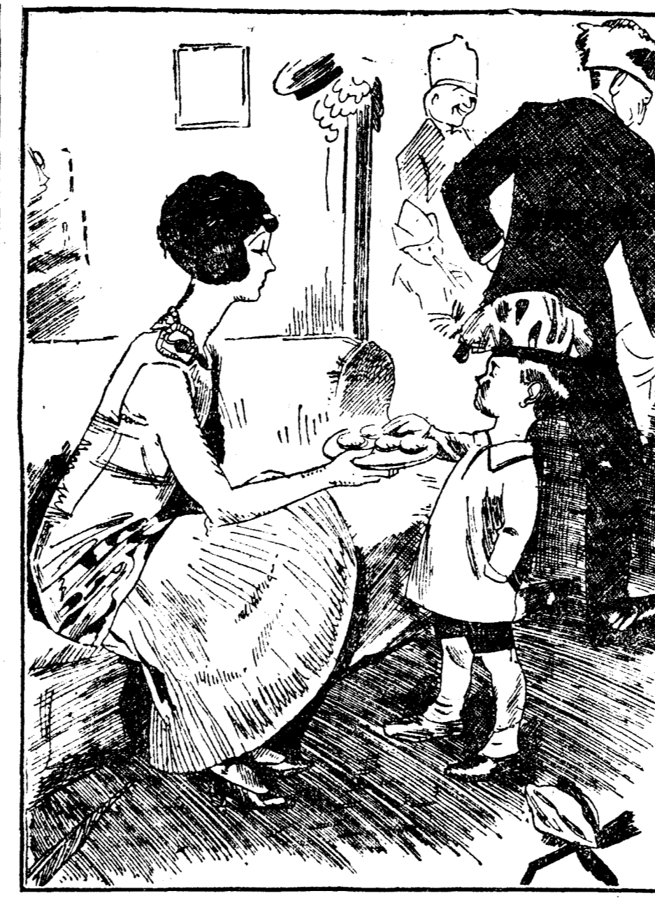
LA SEÑORA (en una fiesta infantil).—¿Vas a tomar aún otro pastel? Puedes ponerte malo. EL NIÑO.—¡Cállate, señora. Acabo de estarlo ahora mismo. De The Humorist, Londres.