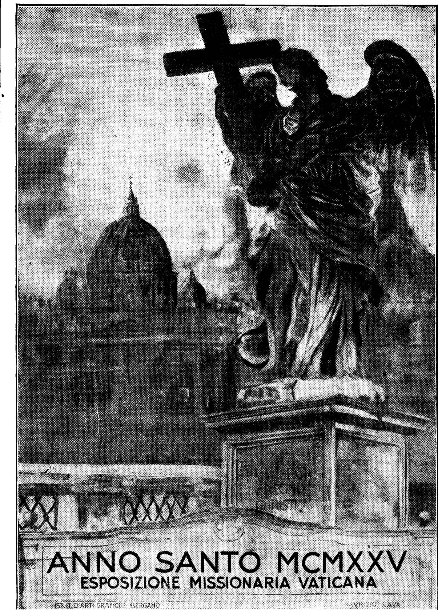
Reproducimos el cartel anunciador del Año Santo; es EL DEBATE el primer periódico del mundo que lo publica