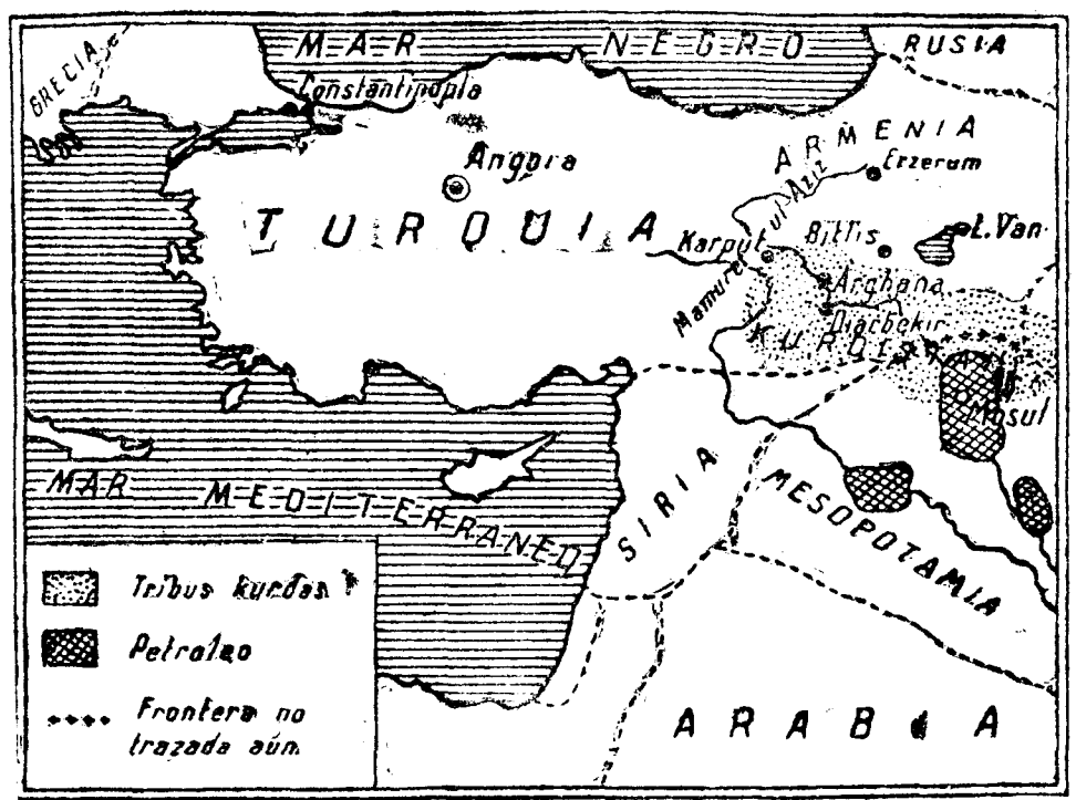
Kharpuz, Malatya y Dersim. Ha llegado a la región de Gindj, ya dentro de la Armenia histórica, y, por último, ha logrado conquistar la importante ciudad de Diarbekir, capital del vilayato del mismo nombre.

Pero lo que distingue esta sublevación de las anteriores, y hace creer que interviene en ella elementos ajenos al Kurdistán, es la existencia de objetivos concretos, tanto en el orden político como en el orden religioso, lo que puede de-