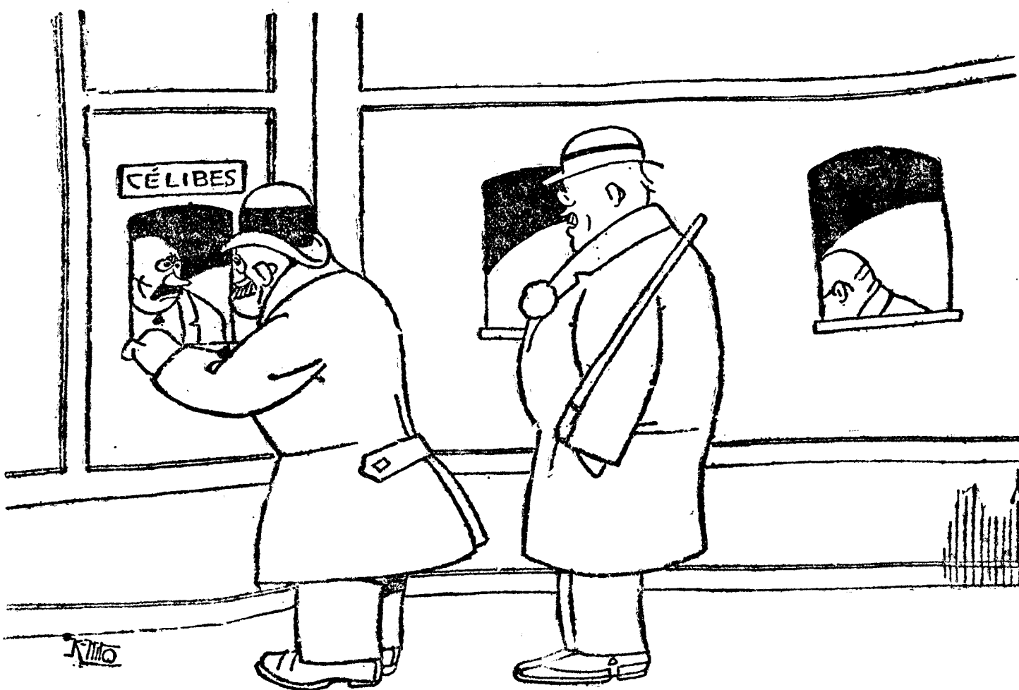
EL CÉLIBE.—¿Cuánto es?