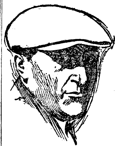
ARTAUDT. Uno de los veteranos corredores que ha llevado al triunfo las más variadas marcas en pruebas clásicas.