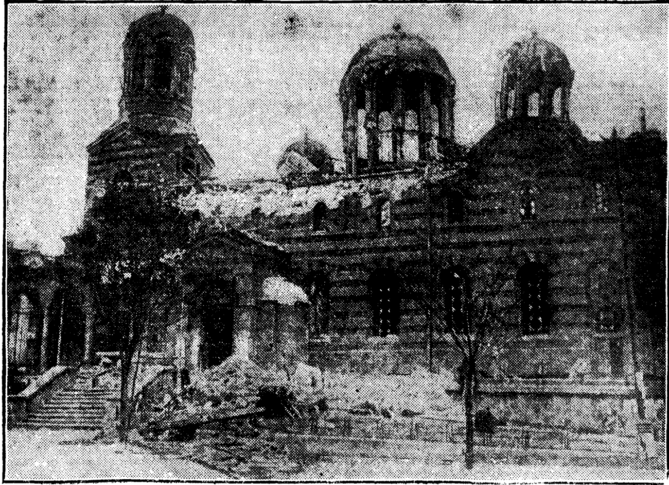
Muestra este grabado, que tomamos del «Times», los destrozos materiales que hicieron en la Catedral de Sofia las bombas que allí colocaron los comunistas el 16 del actual. La historia del salvaje atentado, conocida al principio de manera imperfecta, va estableciéndose ya sobre base más firme. Existe la seguridad de que había un complot, organizado por la Tercera Internacional, para asesinar al Rey y a los ministros y proclamar la república soviética. La bárbara intención no ocasionó al pronto, como es sabido, sino 140 víctimas inocentes.