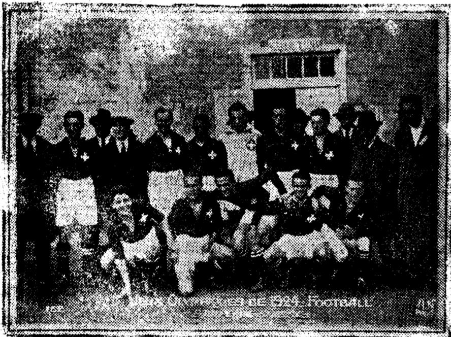
Equipo que representará a Suiza en los Juegos Olímpicos. Con excepción del portero, es el que luchará el lunes contra la selección española.