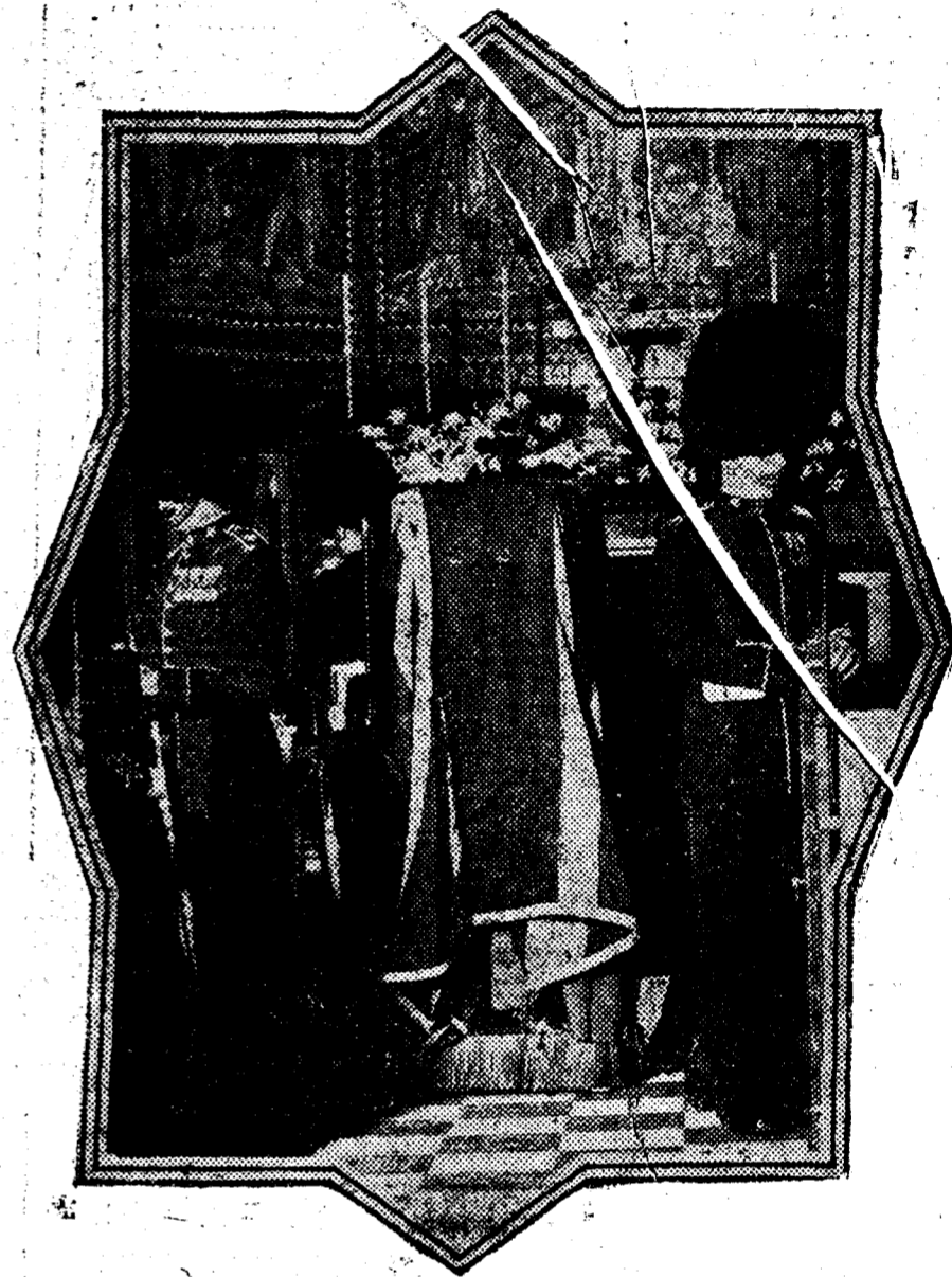
La capilla ardiente en Wellington Barracks