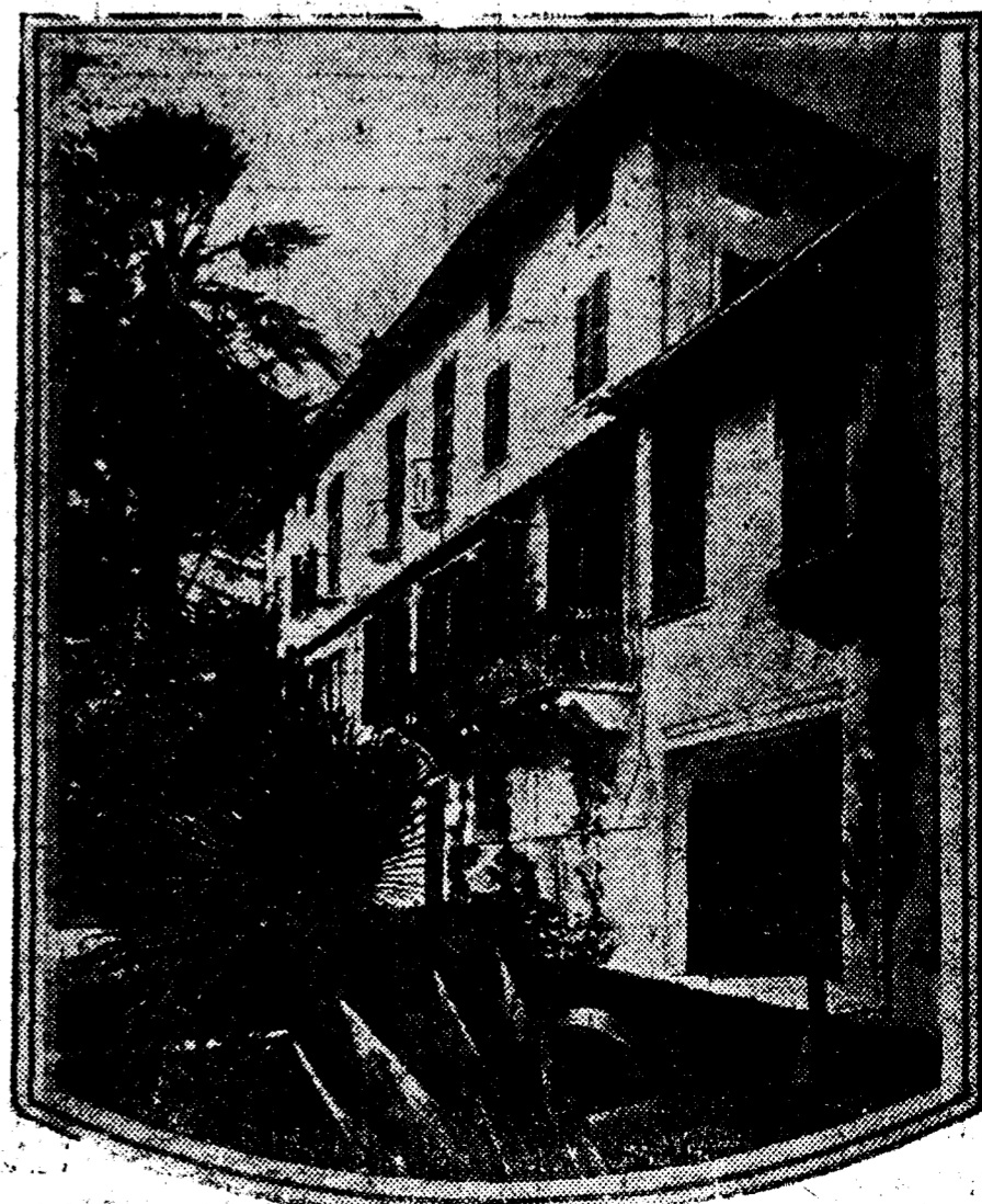
MUSSOLINI Y D'ANNUNZIO.—La villa «Vittoriale», que D'Annunzio ha convertido en un Museo de la Victoria y regala al Estado italiano. En ella se ha celebrado la tan comentada entrevista entre el poeta y el jefe del fascismo.