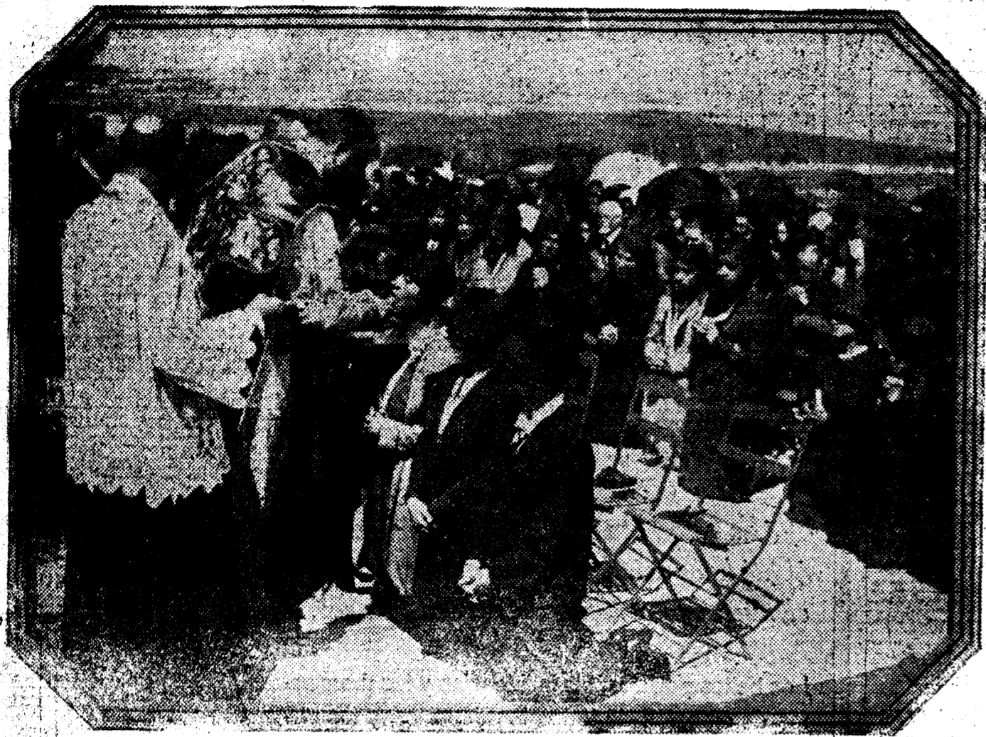
El Nuncio de Su Santidad distribuyendo la Comunion a los peregrinos.