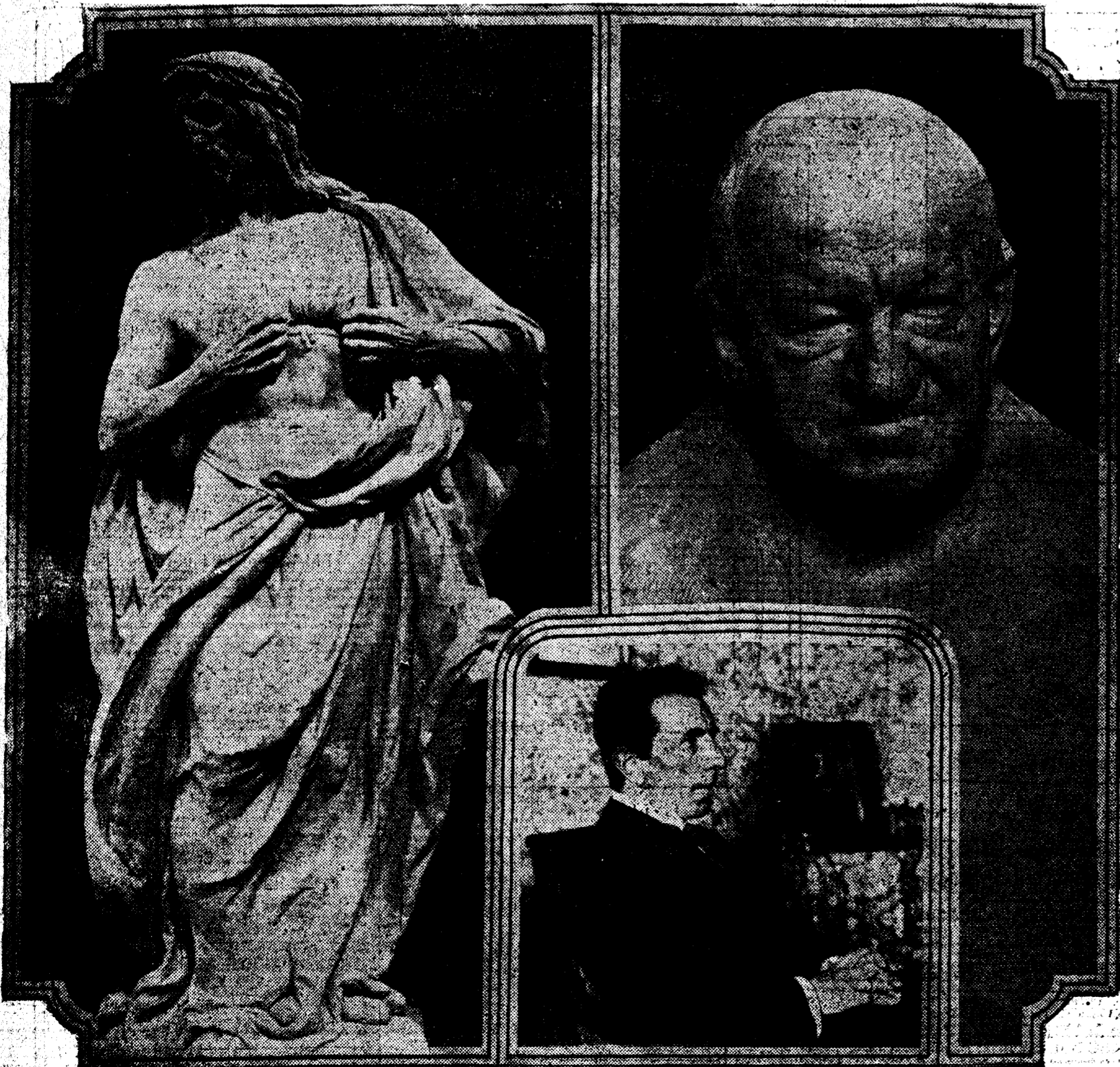
El escultor alemán Augusto Weckbecker, y dos de sus obras más notables: el Corazón de Jesús, de la iglesia de Solothur (Suiza), y un busto del Cardenal Fruehwirth.