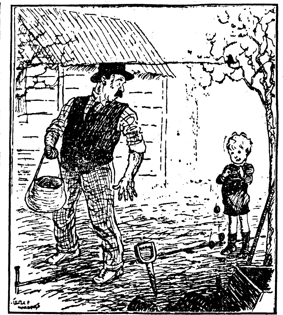
EL NIÑO: ¡Mira, papá! ¡He sacado todas, todas las patatas que metiste ayer debajo de tierra!