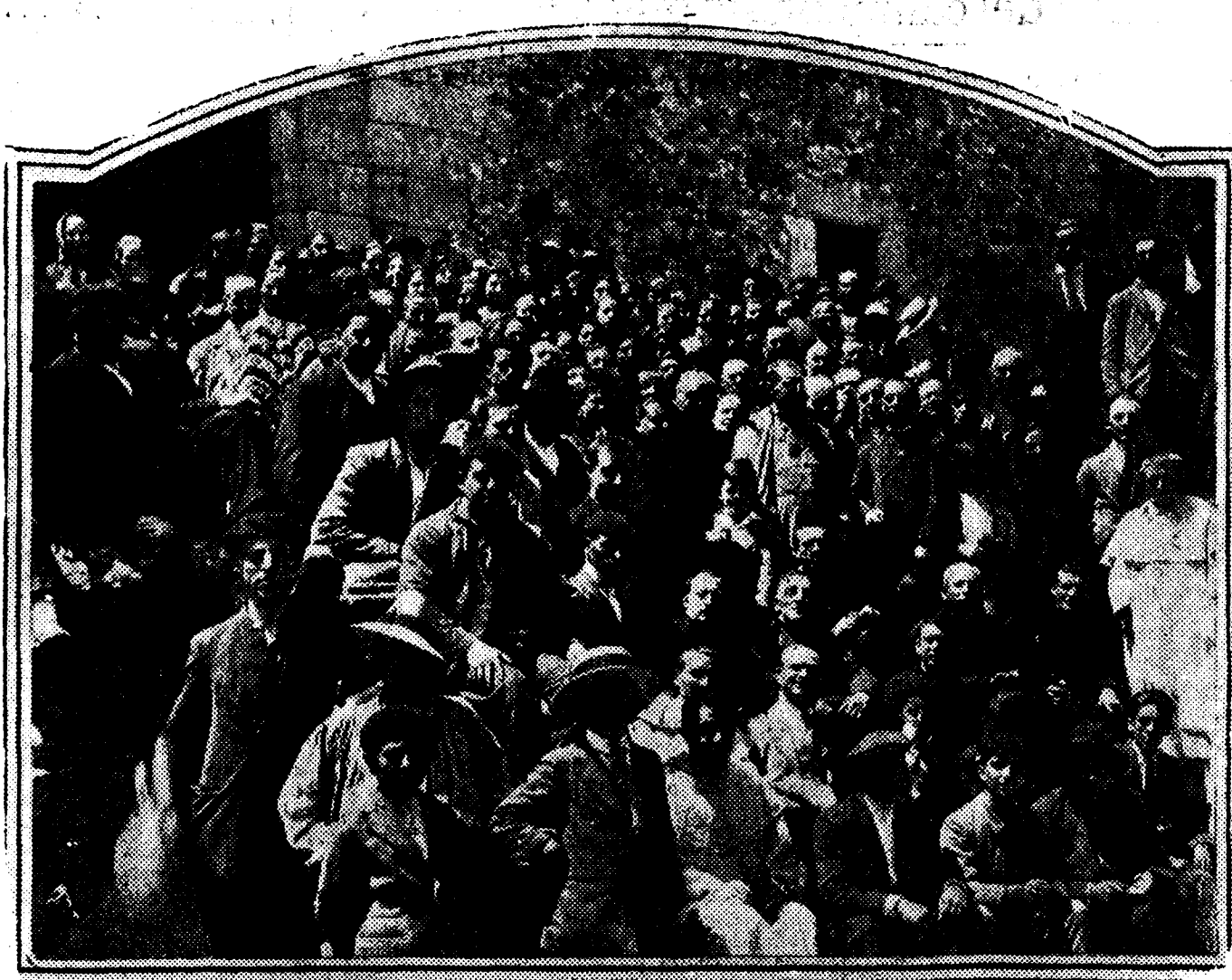
El ilustrísimo señor don Silverio Velasco, Obispo de Ciudad-Rodrigo, rodeado de los peregrinos en la escallinata del histórico santuario, a donde acudió una caravana de 50 automóviles para adorar a la milagrosa imagen y estudiar las restauraciones necesarias para celebrar el quinto centenario de la aparición de la Santísima Virgen en esta gloriosa montaña