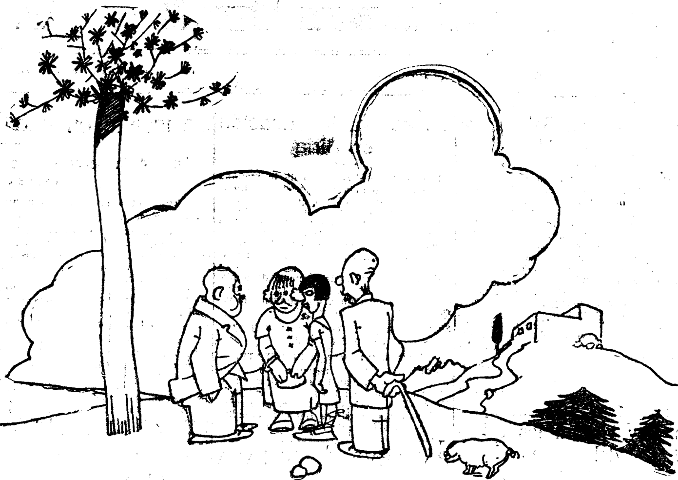
—Esto es sanísimo. Cuando lo vine aquí pesaba diez kilos y hoy peso noventa y siete. —¿Y cuándo vino usted? —A los dos años.

límite, tras pasado el cual se engendrarían el día de mañana peligros más grandes todavía que los actuales. Las negociaciones y «pourparlers» no han retardado nunca, en ninguna ocasión, los preparativos de operaciones militares y el envío de fuerzas capaces de evitar la repetición de las agresiones de que los franceses han sido víctimas. Francia ha tratado todavía una vez más dentro de los límites de lo posible, de establecer la paz en Marruecos antes de proceder a desplegar y demostrar su fuerza. Los rifteños deben, pues, escoger sencillamente entre la paz y la guerra.