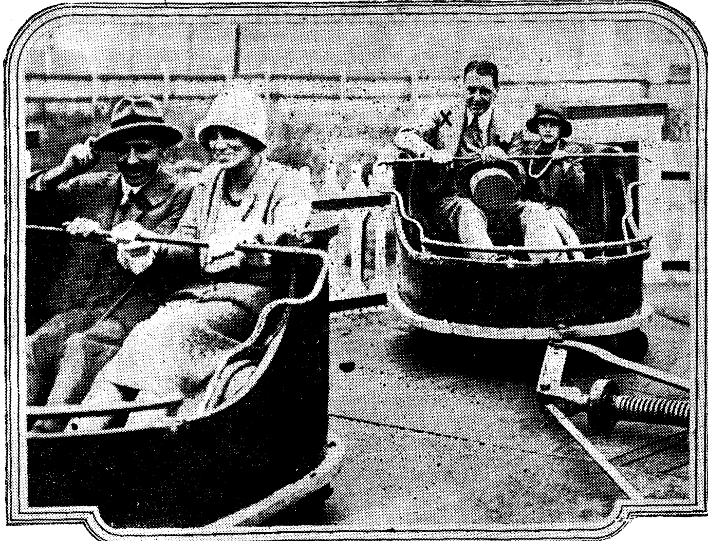
Lord Birkenhead, secretario de Estado para la India, con su hija menor en un carousel de Wembley