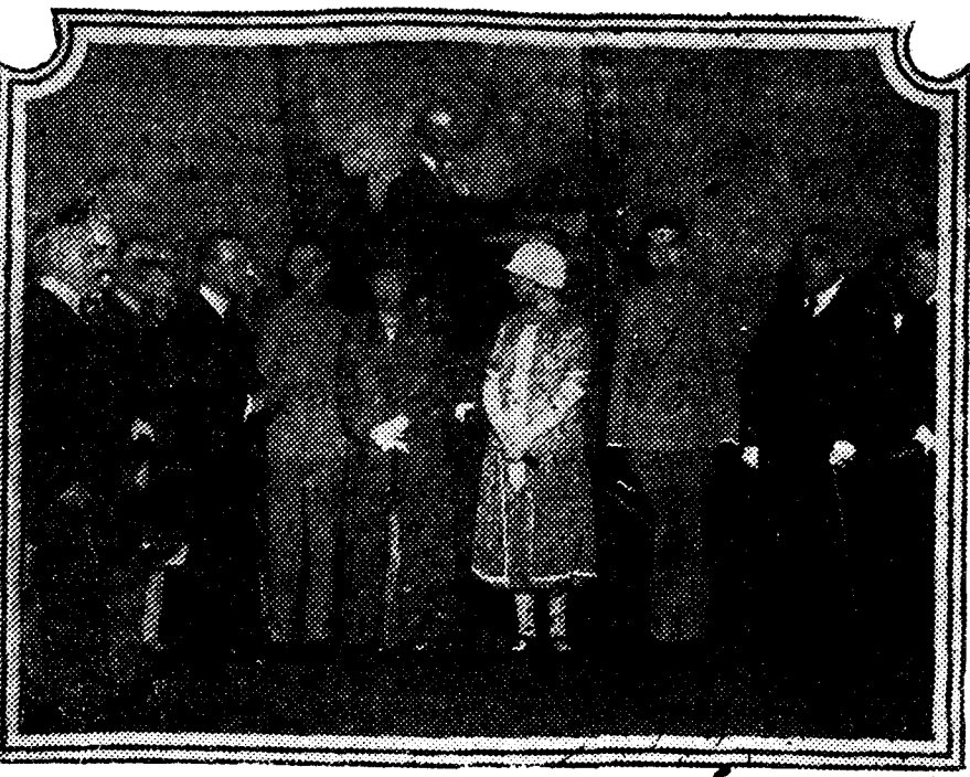
La Reina madre inaugurando en el Ateneo guipuzcoano la Exposición-homenaje al pintor Elías Salaverría, por su cuadro «La Coronación de la Virgen de Aranzazu»