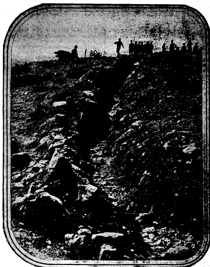
Trincheras enemigas tomadas al asalto por nuestras tropas en las operaciones del día 23.