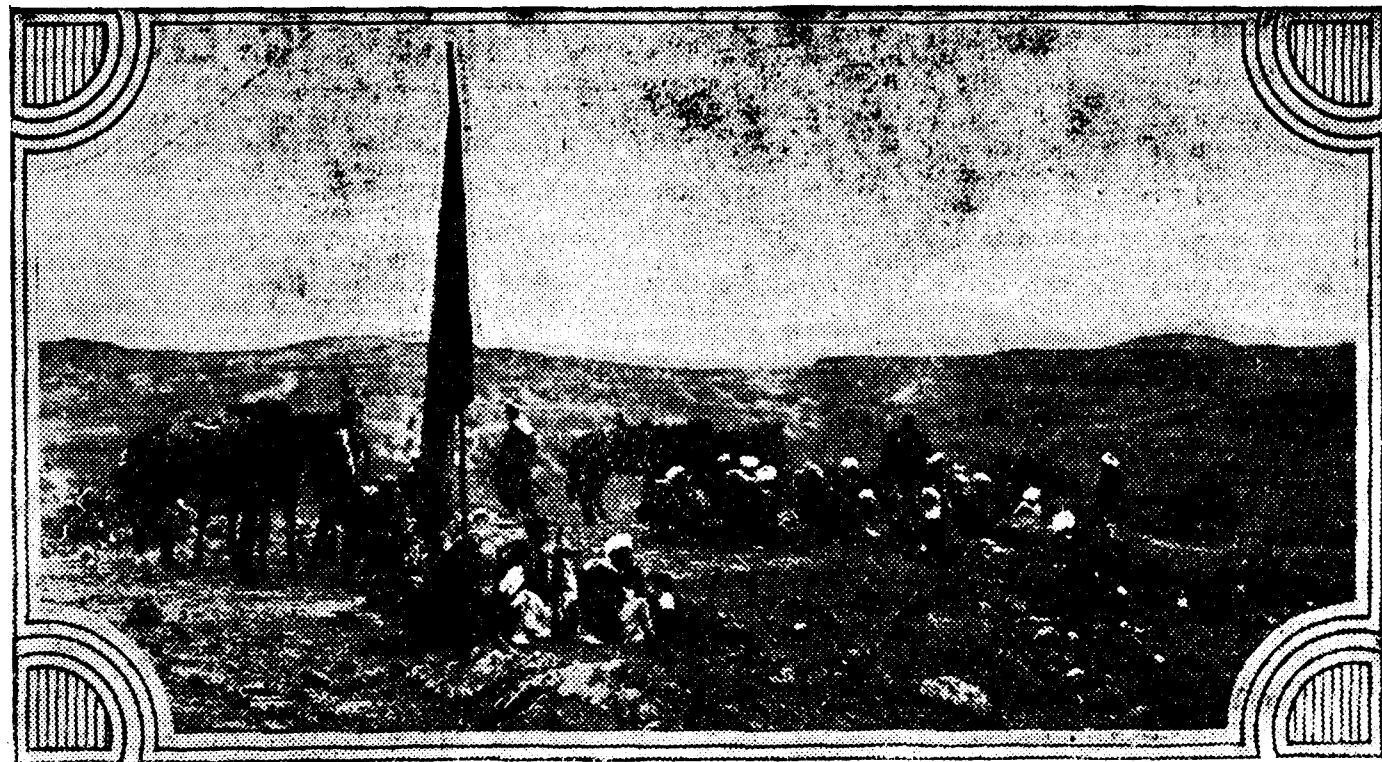
Primera bandera española que se colocó en el avance del día 23