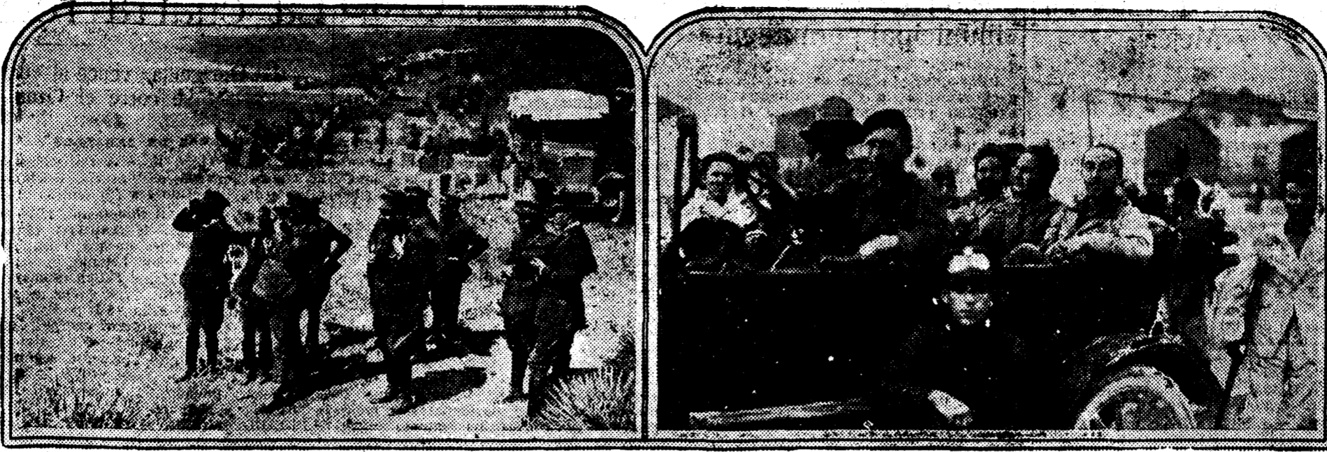
Los generales Primo de Rivera (1), Barón de Casa Davalillos (2), Despujols (3) y Souza (4) observando la marcha de las columnas sobre la cabila de Kudia Tahar. A la derecha la oficialidad que resistió un asedio de diez días en la citada posición