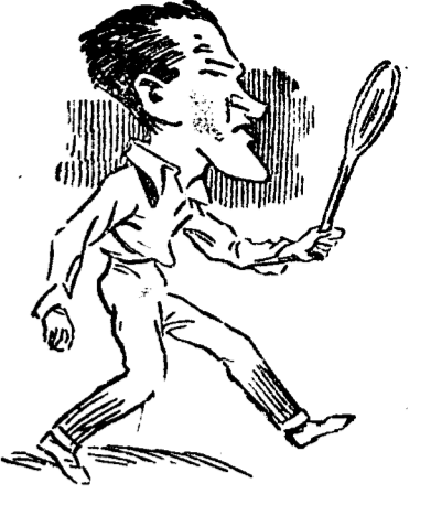
GERALD L. PATERON Campeón australiano de tenis, considerado como uno de los mejores raquetistas del mundo, vencedor del primer partido individual entre Australia y Francia en el actual concurso por la Copa Davis .