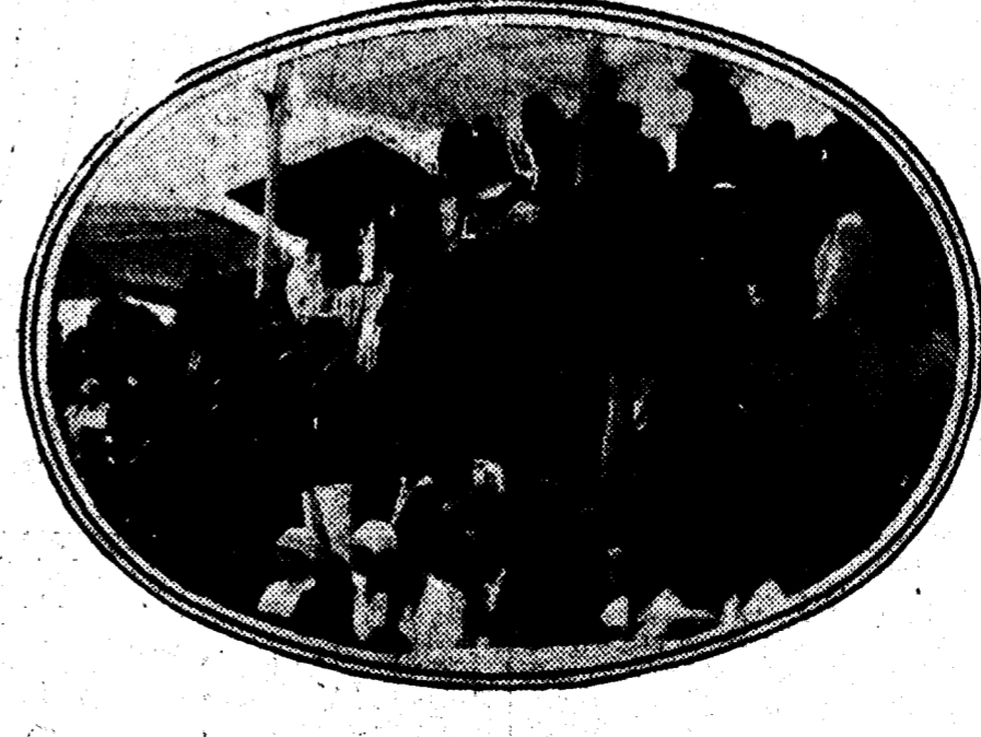
Presidencia de la becerrada benéfica durante la cual resultó cogido Belmonte