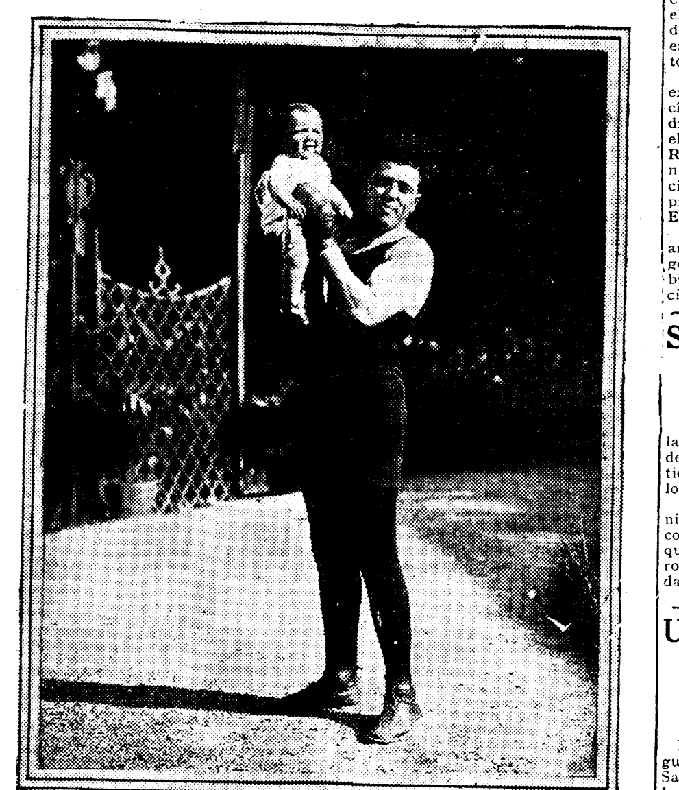
Erminio Spalla, el boxeador italiano, con su hijo. Spalla, campeón de Europa, luchará con el español Uzcudun el próximo día 15