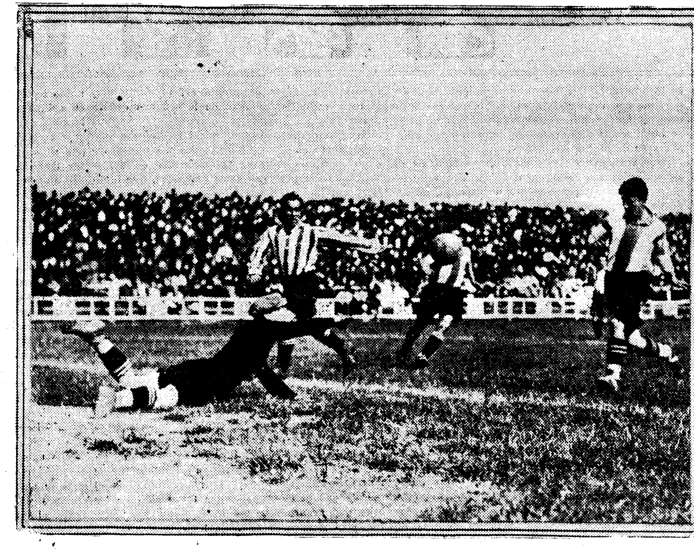
El guardameta atlético despeja un tiro del delantero centro contrario