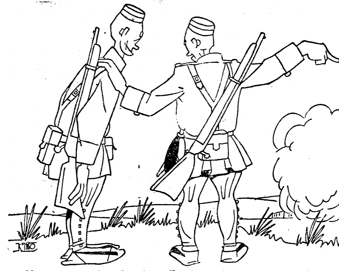
—No se privaba de nada, chico. Escribanía de plata, agua corriente, teléfono... y, mira, hasta calefacción central.