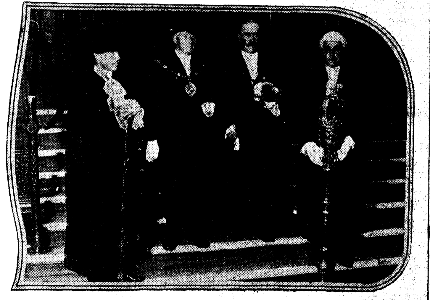
Sir William Pryke, elegido lord mayor de Londres (a la derecha), en compañía del lord mayor actual, Sir Alfred Bower. A ambos lados los alguaciles mayores