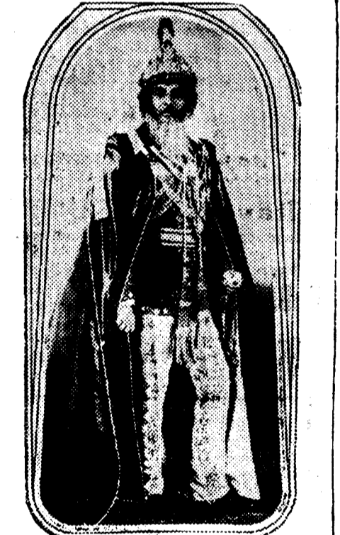
El maharajah de Nepal, que ha suprimido la esclavitud en sus dominios.