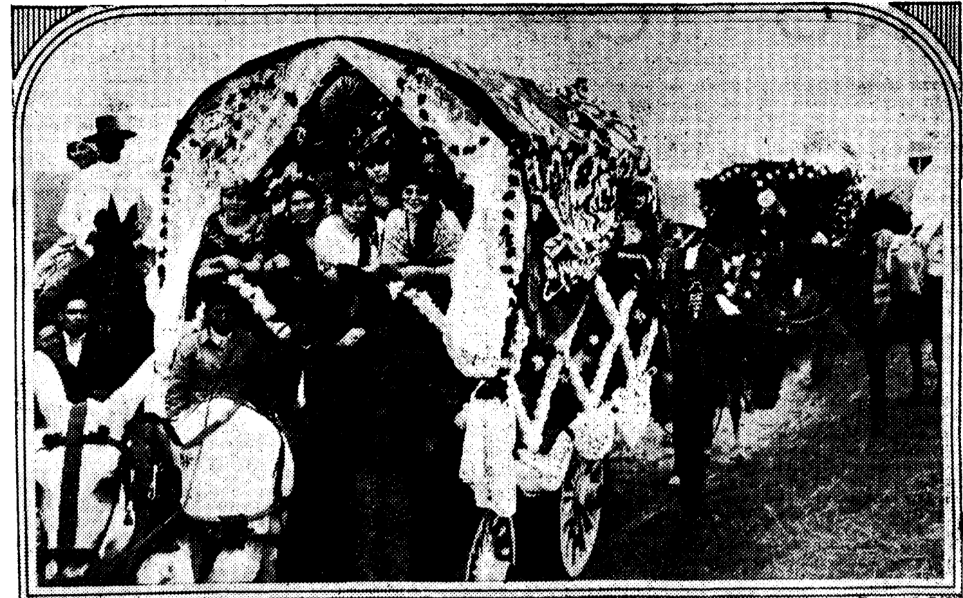
Una de las carretas con vecinos de Dos Hermanas, dirigiéndose a la romería del Cuarto