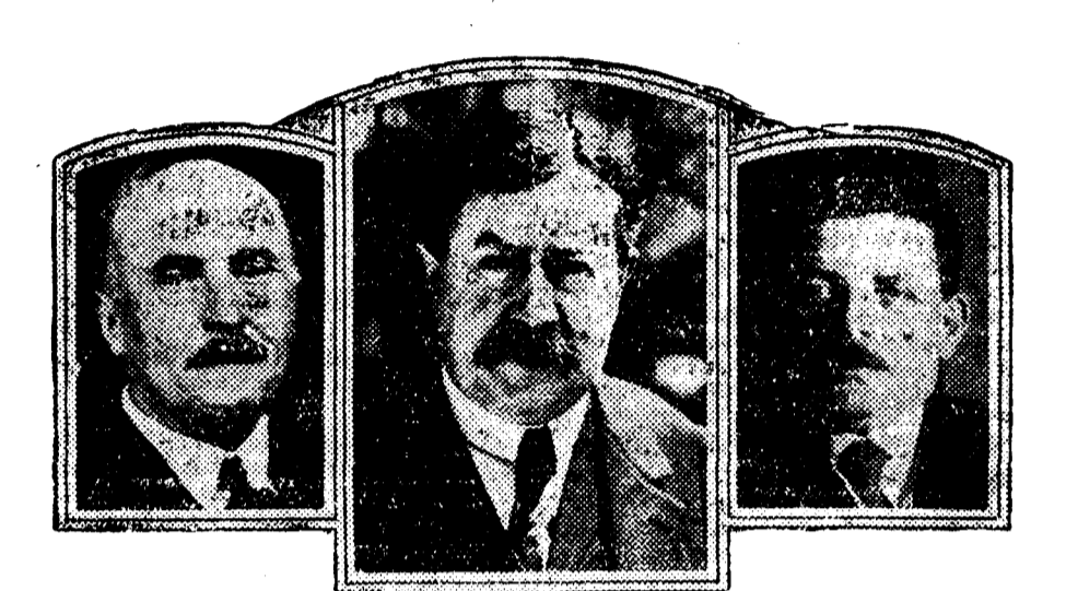
En el centro Painlevé, a la izquierda Caillaux y a la derecha Herriot, los dos jefes cuya lucha ha sido la causa principal de la crisis

pasa de los 100.000 millones; los adelantos del Banco de Francia son algo más de 30.000 millones. Los intereses de esta deuda interior consumen las dos terceras partes del presupuesto francés. Y a todo esto hay que añadir los 40.000 millones de francos oro que debe—casi por partes iguales—a Inglaterra y los Estados Unidos.